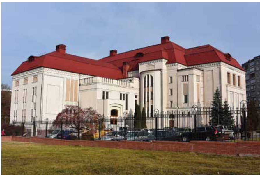
5. Königsberg. Dawny budynek Domu Społecznego, proj. R. Seel. 1911–1912