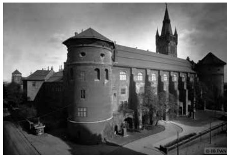
3. Königsberg. Zamek królewski

wyjątkowo funkcjonalne. Wśród nich nie spotkamy dzieł sztuki, ale nie takie miało być ich przeznaczenie” – napisał niemiecki historyk miasta F. Gause 5 .