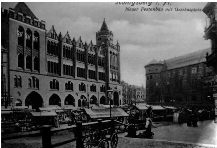
4. Królewiec (Königsberg). Nowa poczta, proj. F. Heitmann. 1901 r.