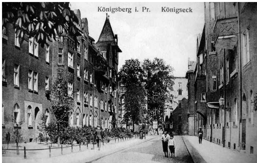
6. Königsberg. Königseck

na Prinzenek w dzielnicy Sackheim (obecnie nie istnieje). Stowarzyszenie było częścią „Generalnej Fundacji Budownictwa Mieszkaniowego”, założonej przez władze miasta w 1904 r. w celu wspierania działalności budowlanej w Królewcu 13 . Budynek dawnego Königseck są częściowo zachowane do dziś, ale sama ulica zmieniła się w zaniedbany wewnętrzny dziedziniec. Od strony Königstrasse prowadziły do niej dwa łukowo sklepione przejścia służące pieszym i pojazdom. Wykonano je w przyziemiu domu przylegającego do słynnej Kreuz-Apotheke. Łuki przejść istnieją po dziś dzień, ale prowadzą do nieprzekraczalnego ślepego zaułka, w który zamieniła się przytulna kiedyś uliczka. Naprzeciw wejścia, po drugiej stronie szerokiej Königstraße, stał ogromny budynek Urzędu Obwodu (nie zachował się).