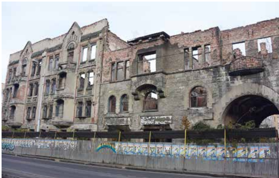
1. Kaliningrad. Ruiny budynków mieszkalnych na ulicy Frunzego (fot. I. Belintseva, 2019 r.)