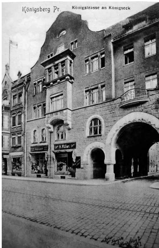
7. Königsberg. Budynek mieszkalny przy Königstrasse

Fasadę wykonano z dużym mistrzostwem, gdyż nieznanemu autorowi udało się połączyć różnorodność form i detali architektonicznych. Na parterze kontrastują kwadratowe otwory okien sklepów pasmanterii i „romańskie” łuki przejścia dla pieszych i przejazdów komunikacyjnych. Witryny szklane są spektakularnie obramowane surowym kamieniem i oddzielone ściankami, które kończą się rzeźbionymi kapitelami, ozdobionymi owsem i stylizowaną imitacją jońskich wolut.