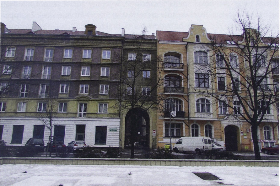
Il. 1. Styk socrealistycznej pierzei Śródmiejskiej Dzielnicy Mieszkaniowej (po lewej) z zabudową z przełomu XIX i XX w. (po prawej), znajdującą się przy ul. Jana Pawła II (dawną ul. Jedności Narodowej) w Szczecinie

Nardegó, absolwenta Wyższej Szkoły Inżynierskiej w Szczecinie. Wraz z grupą młodych architektów Nardy wchodził w życie zawodowe w początkach lat 50. XX w. i podobnie jak jego rówieśnicy w innych ośrodkach rozpoczął swe pierwsze prace w stylistyce socrealizmu, aby w kolejnych latach – jako pracownik Biura Projektów i Studiów Budownictwa – tworzyć po październiku 1956 r. w stylistyce modernizmu 10 .