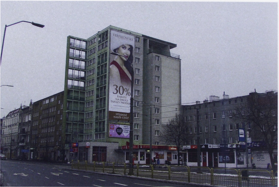
Il. 9. Budynek mieszkalny z usługami przy ul. Krzywoustego 60–61 w Szczecinie, autorstwa Mieczysława Janowskiego

Potrzeby mieszkaniowe wpłynęły na powstanie mniejszej od planowanej i rzeczywiście potrzebnej dla prawidłowego funkcjonowania obszaru liczby obiektów publicznych. Nie mniej jednak i w tym obszarze powstało kilka charakterystycznych budynków, które ze względu na rozwiązania urbanistyczne podzielić można na dwa podstawowe typy: