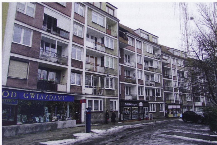
Il. 3. Fragment zabudowy Starego Miasta w Szczecinie z łukowato ustawioną pierzeją przy pl. Orła Białego