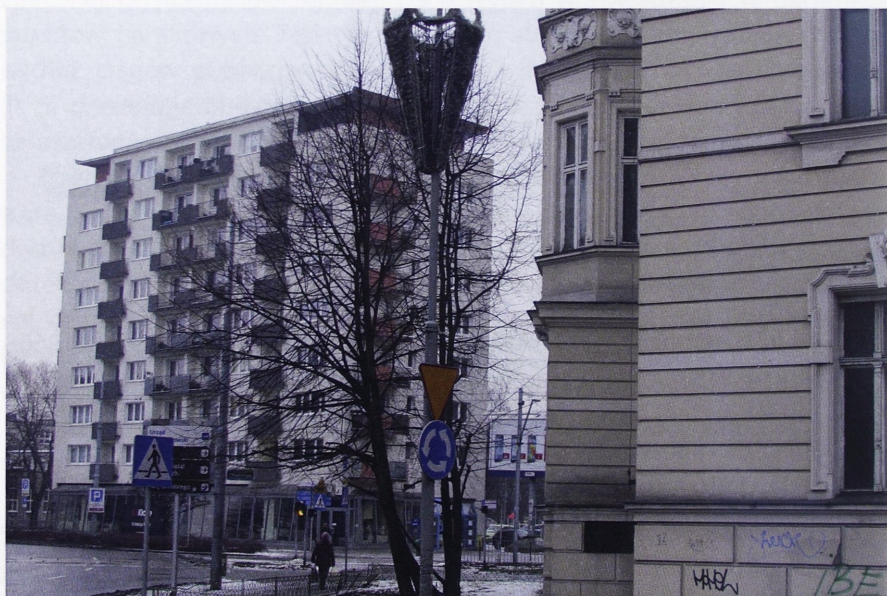
Il. 6. Budynek mieszkalno-usługowy przy pl. Grunwaldzkim w Szczecinie autorstwa Tadeusza Ostrowskiego (po lewej) w zestawieniu z historyczną zabudową placu