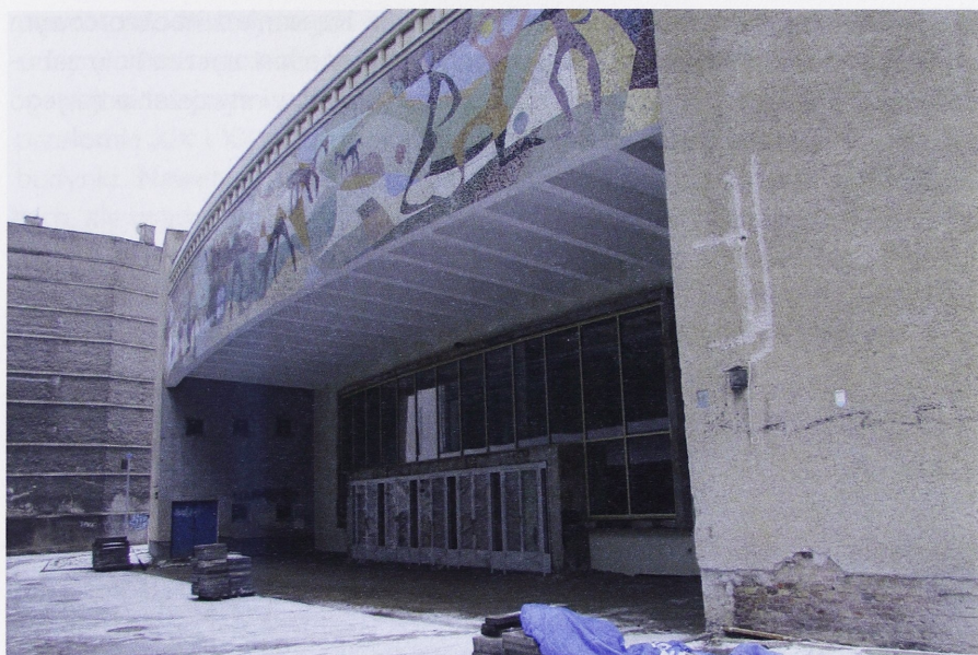
Il. 10. Fragment fasady kina „Kosmos” przy ul. Wojska Polskiego 8 w Szczecinie, autorstwa Andrzeja Korzeniowskiego. Mozaika autorstwa Emanuela Messera – stan w czasie prac modernizacyjnych

gabarytowych kin, które w latach 50. i 60. powstały w całej Polsce 17 . Na podkreślenie zasługują tu także rozwiązania frontowej mozaiki autorstwa Emanuela Messera (il. 10).