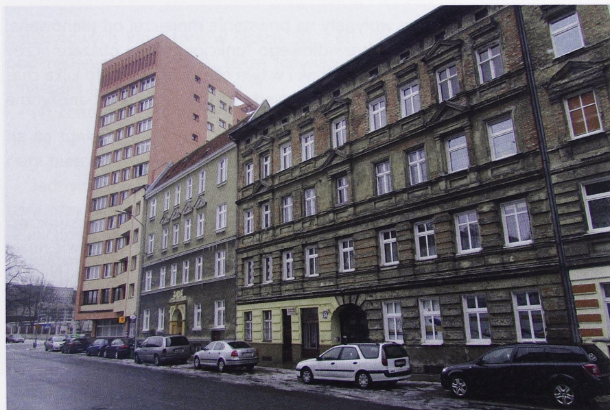
Il. 8. Budynek mieszkalny z biurami na parterze przy ul. Wielkopolskiej 43 w Szczecinie, autorstwa Tadeusza Ostrowskiego