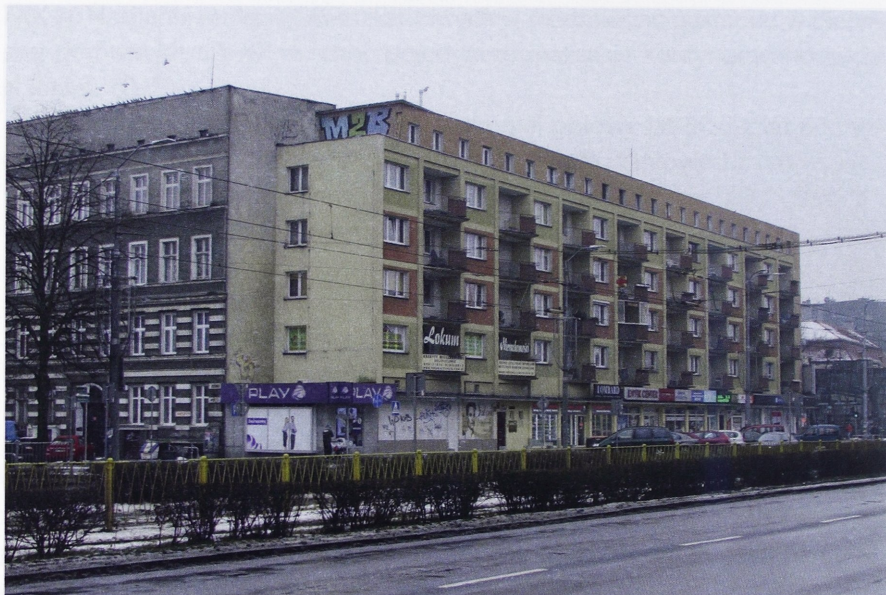
Il. 5. Budynek mieszkalny z lokalami usługowymi w parterach, przy ul. Wyzwolenia 4, 4a i 4b w Szczecinie