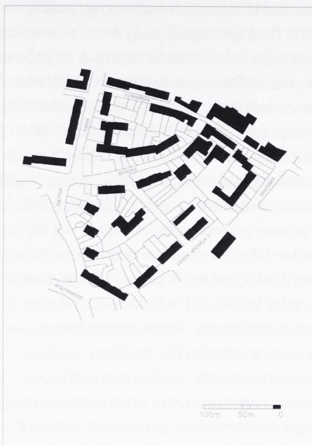
Il. 2. Zestawienie fragmentu układu urbanistycznego Szczecina wraz z podziałem własnościowym zabudowy Starego Miasta sprzed zniszczeń II wojny światowej z budynkami powstałymi w drugiej połowie lat 50. XX w. (oprac. K. Bizio)