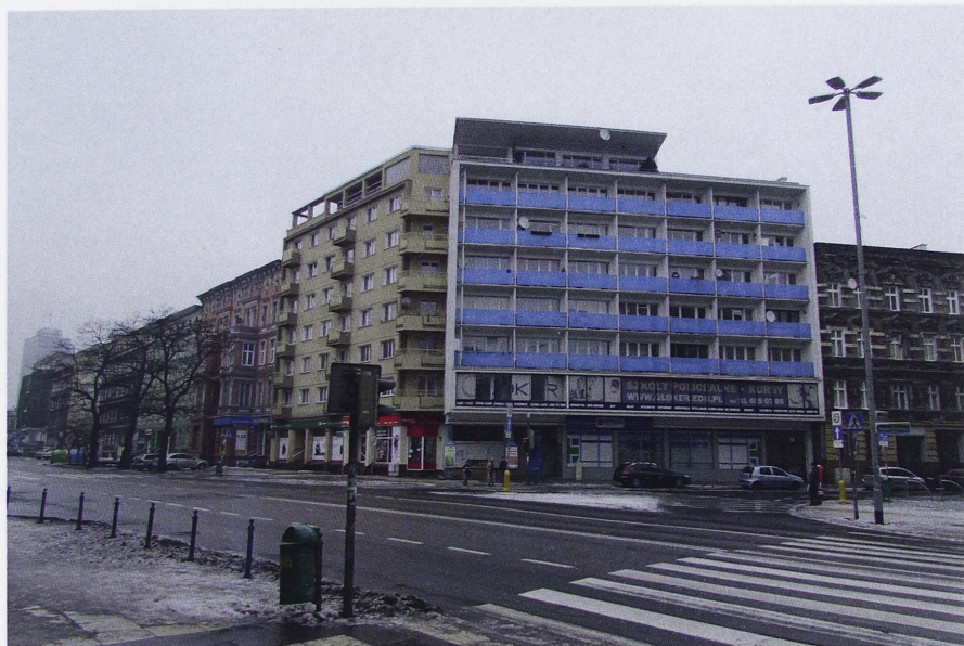
Il. 7. Budynek narożny na skrzyżowaniu ulic Jagiellońskiej i Wojska Polskiego w Szczecinie, autorstwa Janusza Karwowskiego