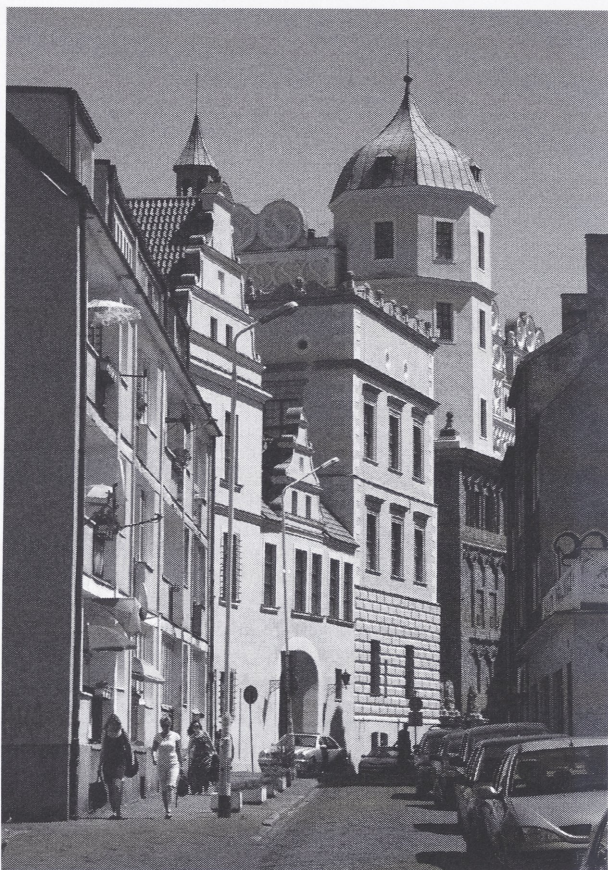
Il. 5. Powojenna zabudowa przy ul. Kuśnierskiej w Szczecinie, w sąsiedztwie odbudowanego Zamku Książąt Pomorskich

W 1955 r. w dolnej części Starego Miasta planowano, lecz nie zrealizowano, budowę czterech jedenastokondygnacyjnych punktowców, uzupełnianych przez pawilony usługowe 22 . Na miejscu wczesnośredniowiecznego podgrodzia, poniżej skarpy zamkowej, planowano urządzenie komponowanego zespołu zieleni, łączącego się z przestrzenią nabrzeża Odry, dla ekspozycji renesansowego gmachu – dawnej siedziby Książąt Pomorskich (il. 5). Na Podgrodziu w latach 60. i 70. zbudowano prostokątną sylwetę hotelu