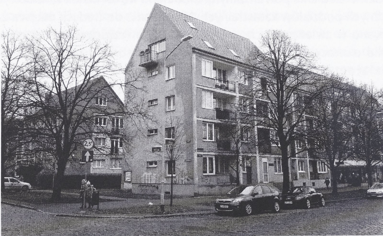
Il. 3. Powojenna zabudowa przy ul. Grodzkiej i ul. Mariackiej w Szczecinie, z charakterystycznymi podziałami modułowych elewacji