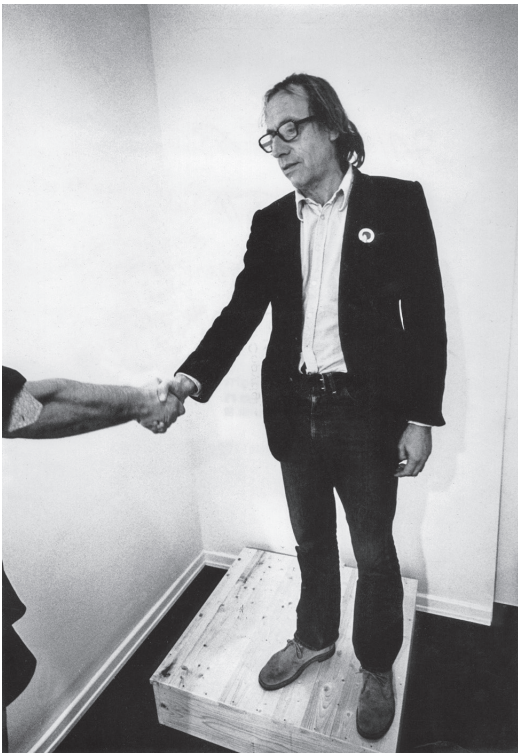
Abb. 4 / Ill. 4 Robert Filliou gibt den Hand- schlag für Angela Davis während seiner Ausstellungseröffnung am 31.10.1971 in der Galerie art intermedia / giving a handshake for Angela Davis during the opening of his exhibition on Oct. 31, 1971 at the art intermedia gallery