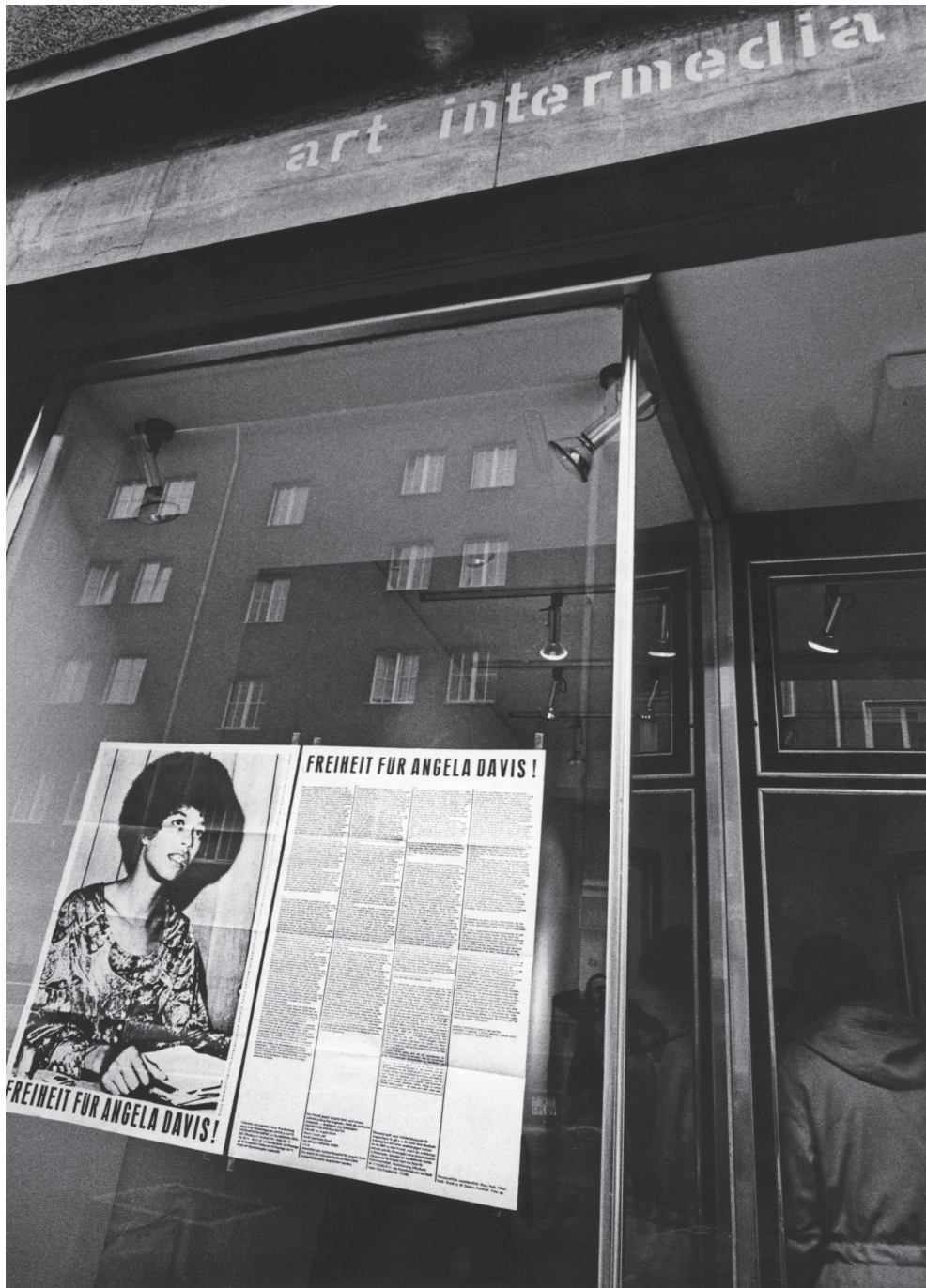
Abb. 1 Schaufenster der Galerie art intermedia mit Plakat / Ill. 1 display window of art intermedia gallery including the poster Freiheit für Angela Davis