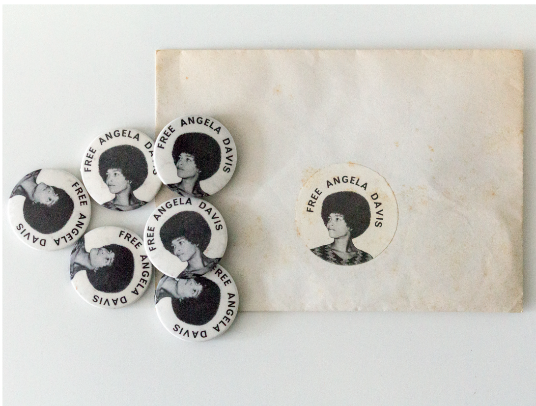
Abb. 8 Buttons und Sticker / Ill. 8 buttons and stickers Free Angela Davis , Foto / photo: © Markus Hoffmann, ZADIK A103, VIII, 16