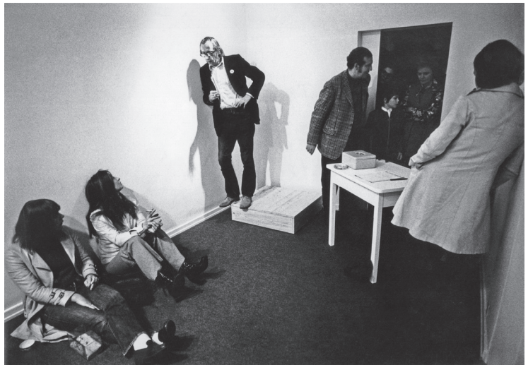
Abb. 5 Blick in die Ausstellung / Ill. 5 view of the exhibition Robert Filliou – Solidarität für Angela Davis, art intermedia, Brüsseler Straße 44, Köln, 31.10.1971 / Cologne, Oct. 31, 1971