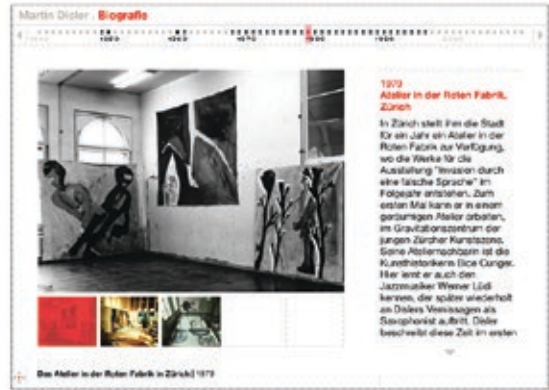
Fig. 3: En 2007, SIK-ISEA a publié sous www.martindisler.ch une documentation en ligne. La page d'accueil élaborée avec soin (animations, fichiers vidéo et audio) donne accès à la biographie de l'artiste et aux diverses facettes de sa création.

La publication électronique des découvertes postérieures à la parution du livre requiert le maintien de compétences spécifiques au-delà de la durée du projet – une exigence à prendre dûment en compte dans la planification et l'engagement des ressources, a fortiori avec l'essor des répertoires et catalogues raisonnés électroniques. Le risque de perte du savoir scientifique nécessaire à un projet, ainsi que la rareté des ressources justifient de mener un travail de réflexion stratégique à long terme sur le genre et l'ampleur des mises à jour à effectuer. Car s'il est possible d'actualiser à peu de frais les références bibliographiques et la liste des expositions, il est