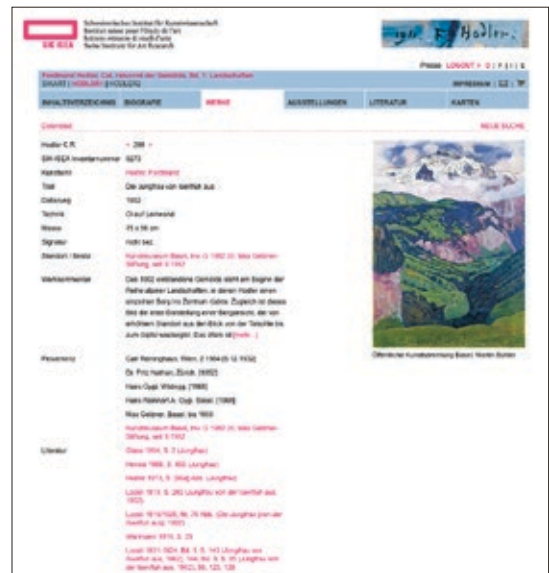
Fig. 4: Le catalogue raisonné électronique des peintures de Ferdinand Hodler, publié depuis 2009 par SIK-ISEA sous www.ferdinand-hodler.ch , est accessible à toute personne ayant acheté l'ouvrage imprimé en s'acquittant d'un modeste supplément donnant un droit d'accès à la version en ligne. Son entrée no 298 comprend une reproduction du tableau Die Jungfrau von Isenfluh et, dans des hyperliens, des renseignements sur la provenance, la bibliographie et les expositions auxquelles l'œuvre a été présentée.