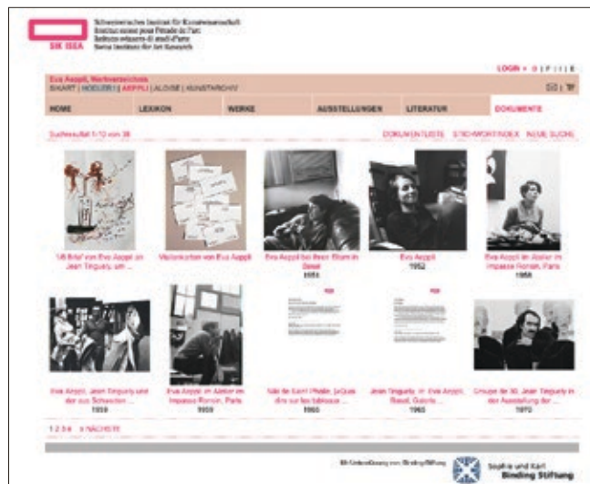
Fig. 6: Le catalogue raisonné électronique publié en 2012 par SIK-ISEA à l'adresse www.eva-aepli.ch est également accessible gratuitement. Des documents et photographies accessibles par recherche en plein texte élargissent le propos du répertoire des œuvres d'Eva Aeppli.