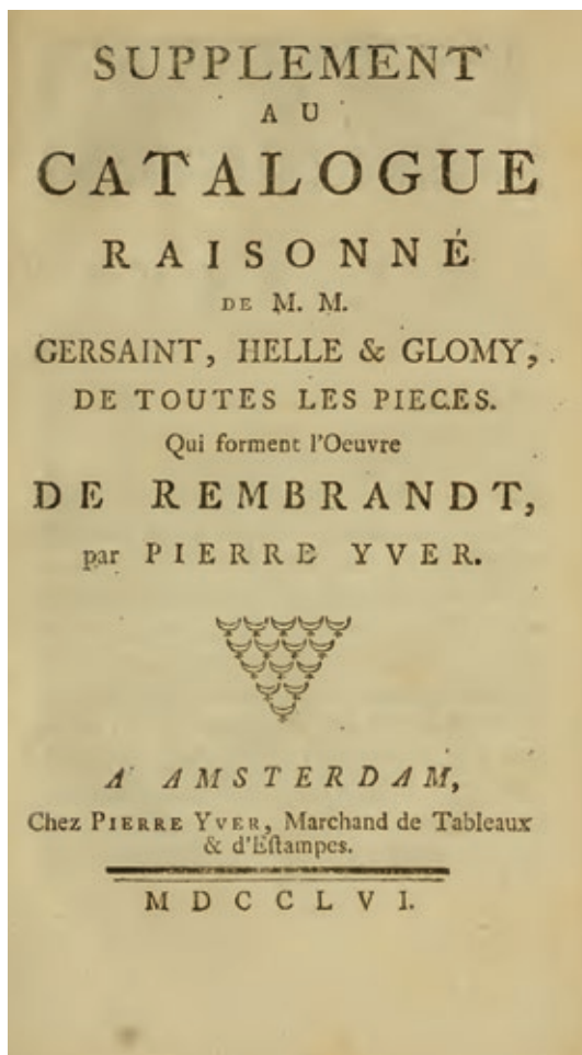
Fig. 1: Pierre Yver, Supplément au catalogue raisonné de M.M. Gersaint, Helle & Glomy, de toutes les pièces qui forment l'œuvre de Rembrandt , Amsterdam: Pierre Yver, 1756, numérisation: The Getty Research Institute, LA

La version en ligne destinée à compléter le livre permet de combiner aux champs de recherche (par terme ou catégorie) des recherches plein texte dans l'ensemble de la publication. Un module