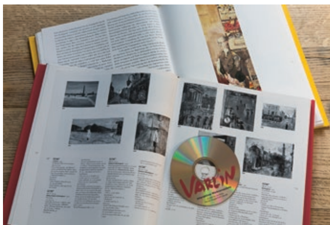
Fig. 2: En 2000, SIK-ISEA a publié avec Paola Tedeschi-Pellanda et Patrizia Guggenheim le catalogue raisonné de Varlin (Willy Guggenheim). Cet ouvrage en deux volumes était accompagné d'un CD-ROM produit par Tobias Eichelberg et permettant des recherches interactives, photo: Philipp Hitz, SIK-ISEA