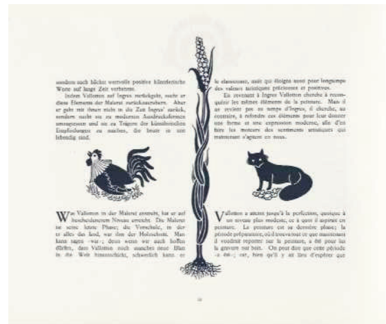
ABB. 4 Julius Meier-Graefe, Félix Vallotton. Biographie , Berlin: J. A. Stargardt / Paris: Edmond Sagot, 1898, S. 10 mit drei Zeichnungen von Félix Vallotton, © Fondation Félix Vallotton / SIK-ISEA