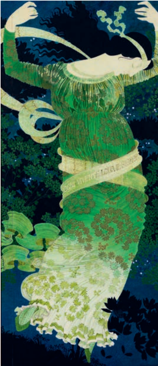
fig. 7 Augusto Giacometti, Die Nacht (Ogni vivente loda il Signore) , 1903, huile sur toile, 251,5 × 110 cm, Confédération helvétique, Office de la culture, cat. 4

à tour figuratifs, abstraits ou informels et caractérisent en même temps plusieurs phases de création. Le vif intérêt que Giacometti porte au phénomène de la couleur et à ses théories constitue l'axe de son œuvre.