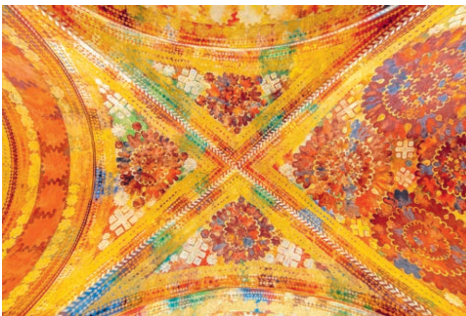
fig. 9 Augusto Giacometti, Gewölbmalerei im Zürcher Amtshaus I (détail avec arc-doubleau au milieu), 1924, peinture a secco et a fresco sur mortier, hall d'entrée de l'Amtshaus I, collection de la Ville de Zurich, cat. 519.1