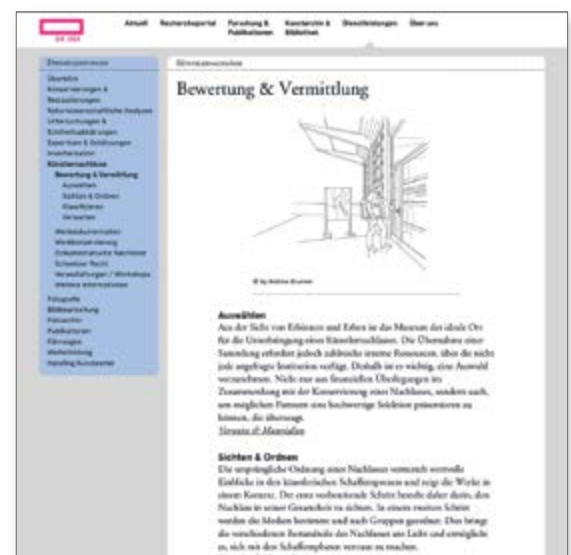
ILL. 5 Constatment mis à jour et commenté: le site web de SIK-ISEA sur le thème des successions d'artistes, www.conseil-successions-artistes.ch