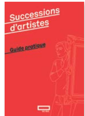
ILL. 3 Facile à lire et d'un format pratique: le guide SIK-ISEA sur le traitement des successions d'artistes.

Les entretiens d'information constituent enfin un domaine d'activités essentiel pour le Centre de conseil. Depuis que le projet a été lancé, plus de 70 demandes individuelles ont été traitées, et nous avons pu dispenser aux personnes concernées des conseils précieux et des astuces utiles. En 2018, des ateliers auront lieu dans les différentes régions linguistiques de Suisse. A cette occasion, des thèmes spécifiques seront étudiés et des solutions possibles pour le traitement des successions d'artistes seront présentées. Ces manifestations devraient, là encore, attirer un public nombreux.