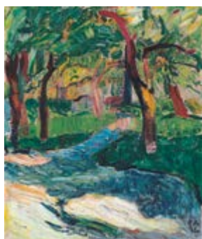
Seiten 38/39 Cuno Amiet, Weg zwischen Obstbäumen