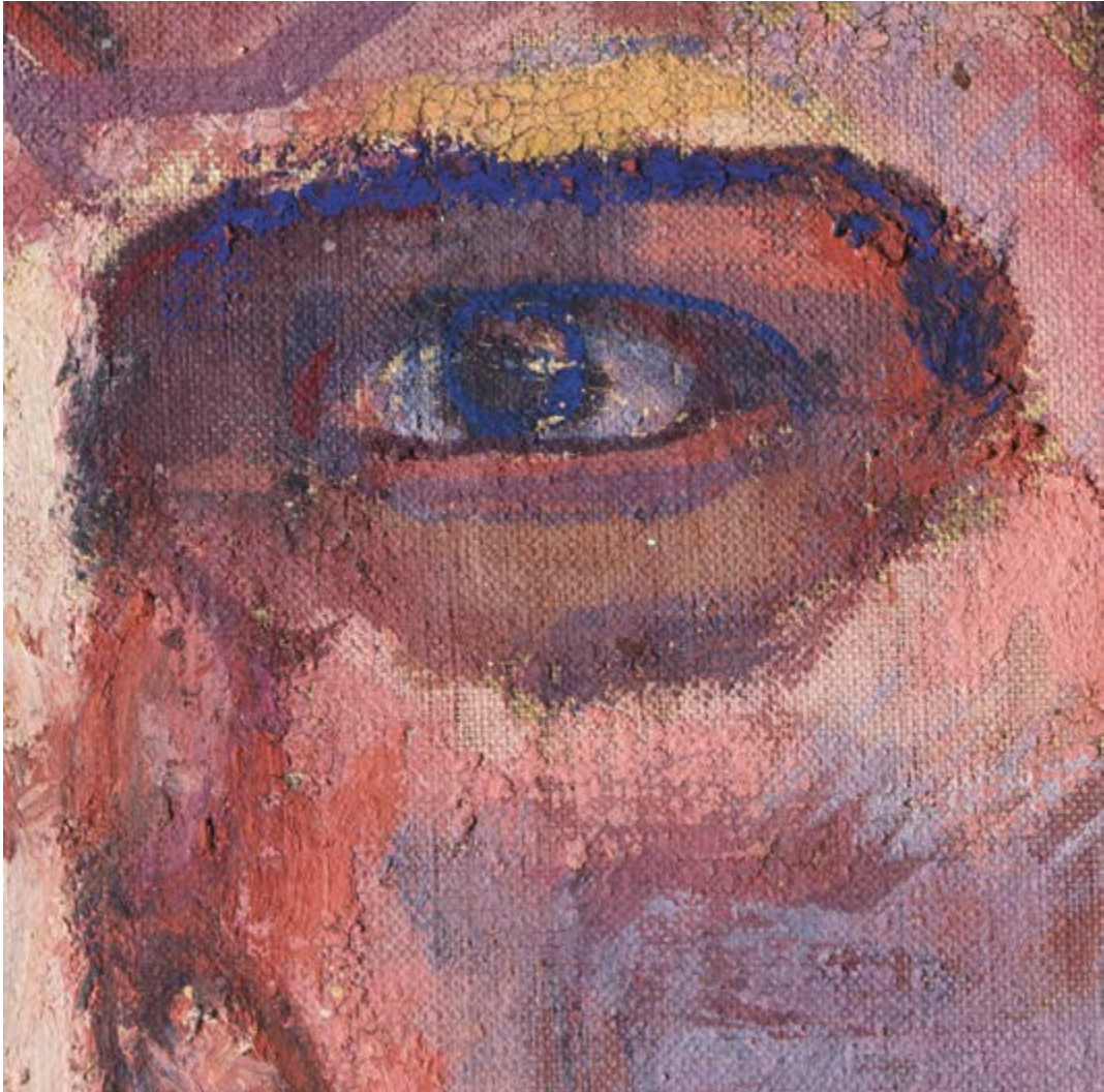
Ferdinand Hodler, Wilhelm Tell (Detail), 1897, Ölfarbe und Ölfarbenstifte auf Gewebe, 256 x 199 cm, Kunstmuseum Solothurn