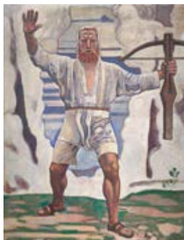
Seite 35 Ferdinand Hodler, Wilhelm Tell