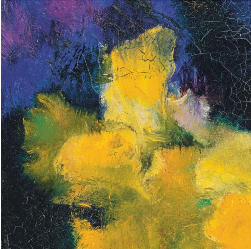
Augusto Giacometti, Osterglocken (Detail), nicht datiert, Tempera auf Gewebe, 24,8 x 33 cm, Privatbesitz