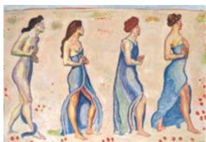
Seite 43 Ferdinand Hodler, Die Empfindung