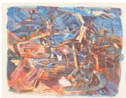
Seiten 44/45 André Thomkins, Ohne Titel