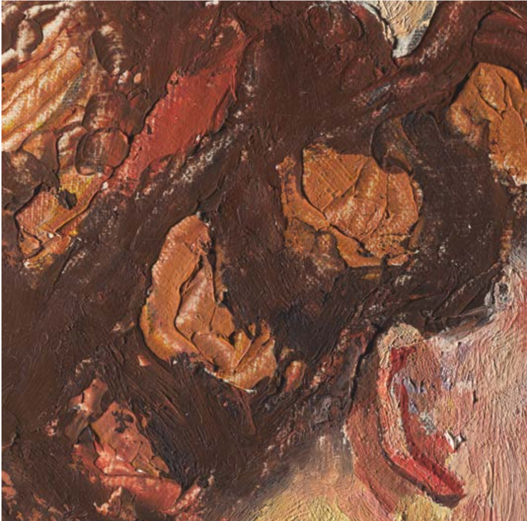
← Hermann Haller, Frauenkopf (Detail), nicht datiert, Gips patiniert, 42 x 26,5 x 26,5 cm, SIK-ISEA, © Präsidi­aldepartement der Stadt Zürich