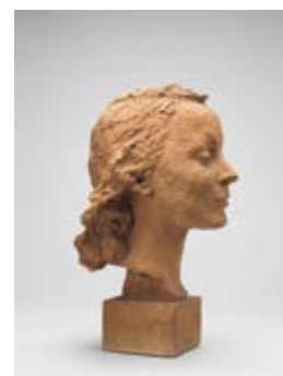
Page 42 Hermann Haller, Frauenkopf