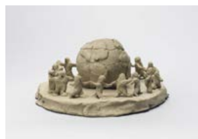
Page 47 Fischli/Weiss, It's a small world