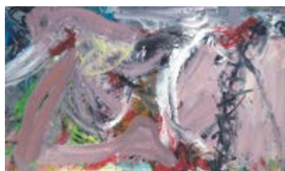
Page de titre Martin Disler, Sans titre

Informations complémentaires sur www.sik-isea.ch/formationcontinue