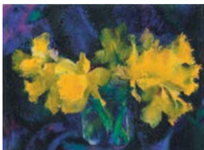
Page 41 Augusto Giacometti, Osterglocken