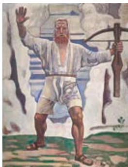
Page 35 Ferdinand Hodler, Guillaume Tell