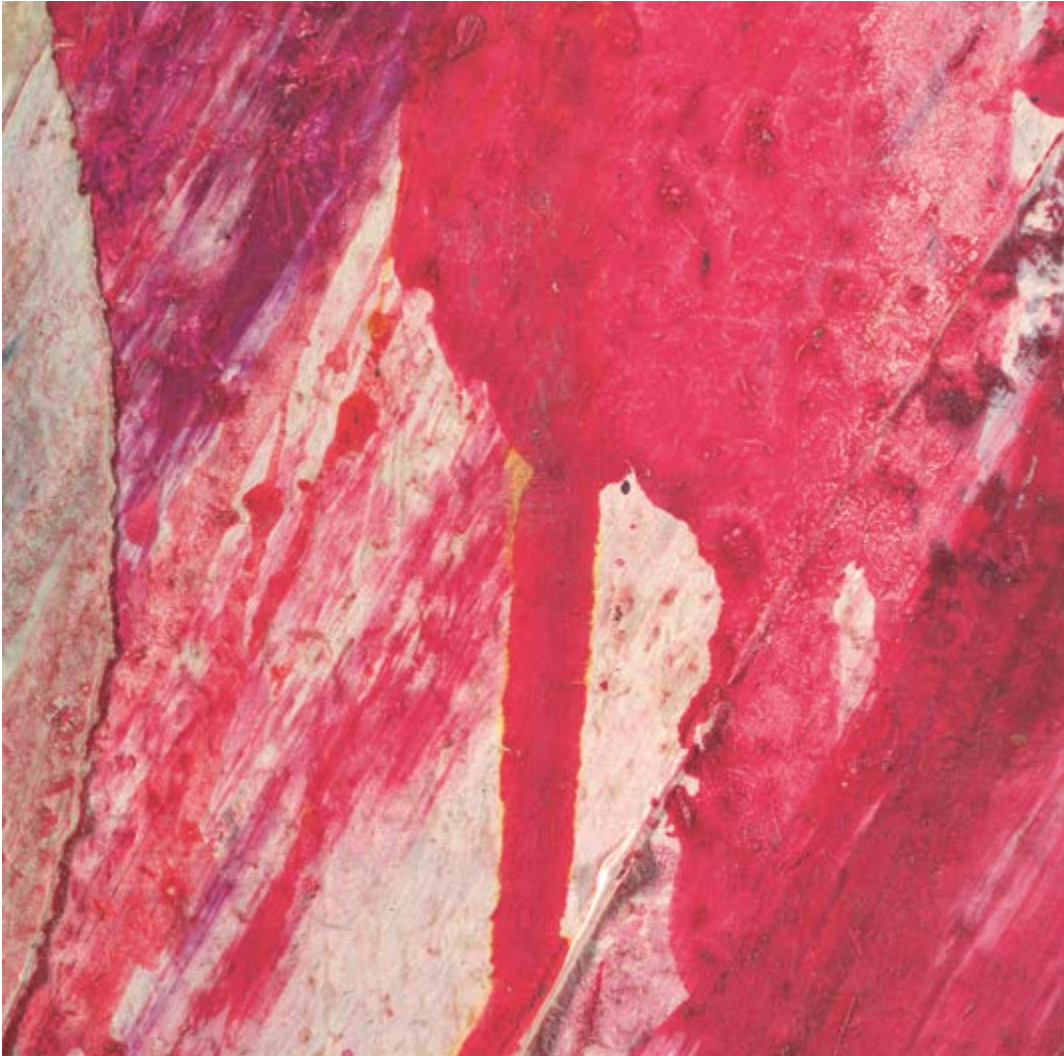
↑ Wilfrid Moser, Motocross (détail), 1962 Huile sur toile, 130 x 97 cm Prêt de la Fondation Wilfrid Moser à SIK-ISEA © Fondation Wilfrid Moser, Zurich