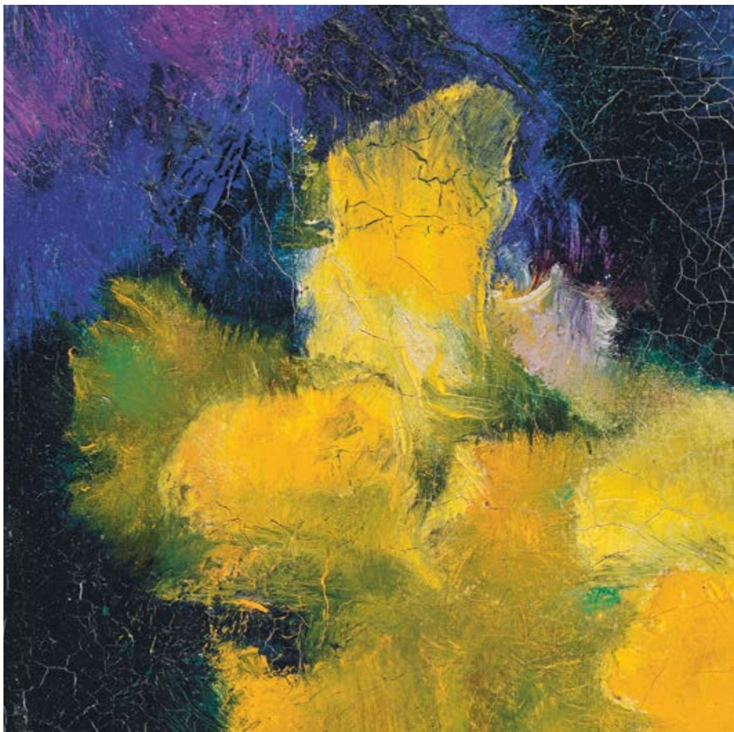
Augusto Giacometti, Osterglocken (détail) Non daté, 24,8 x 33 cm Détrempe sur toile, collection privée