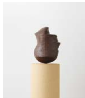
Page 37 Markus Raetz, Kopf II