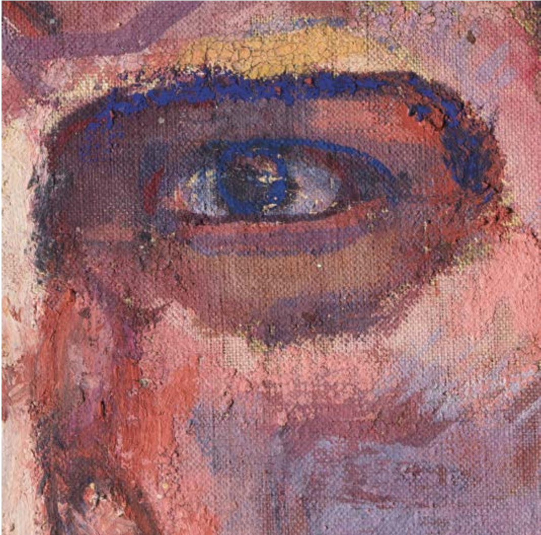
Ferdinand Hodler, Guillaume Tell (détail), 1897 Huile et pastel à l'huile sur toile, 256 x 199 cm Kunstmuseum Solothurn