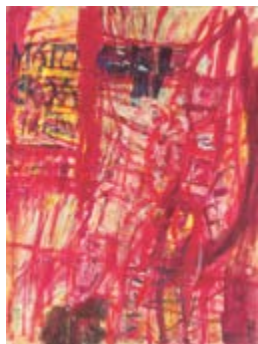
Page 36 Wilfrid Moser, Motocross