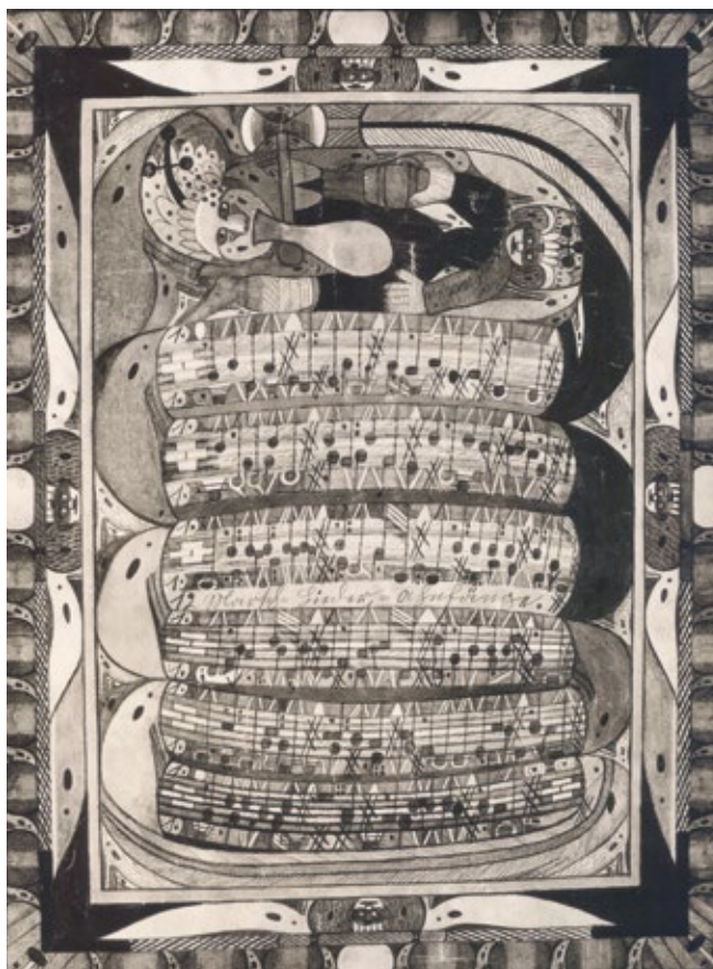
Fig. 3: Adolf Wölfli, Saint Adolf mordu à la jambe par le serpent , 1921, mine de plomb et crayon de couleur sur papier, 68 x 51 cm, Lausanne, Collection de l'Art Brut, illustration destinée à l' Almanach de l'Art Brut