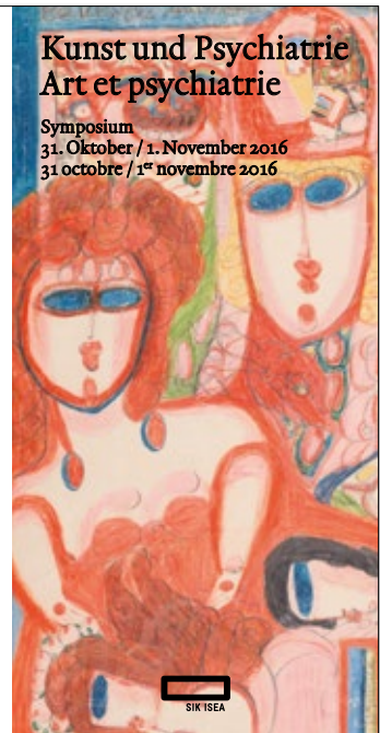
Abbildung: Aolise Corbax, Dans le Mantoux Impérial de Marie Stuart Médici (Ausschnitt), 1946, Farb- und Bleistift auf Papier, 58 x 49 cm, © Fondation Aolise, Chiguy, Foto: Collection de l'Art Brut