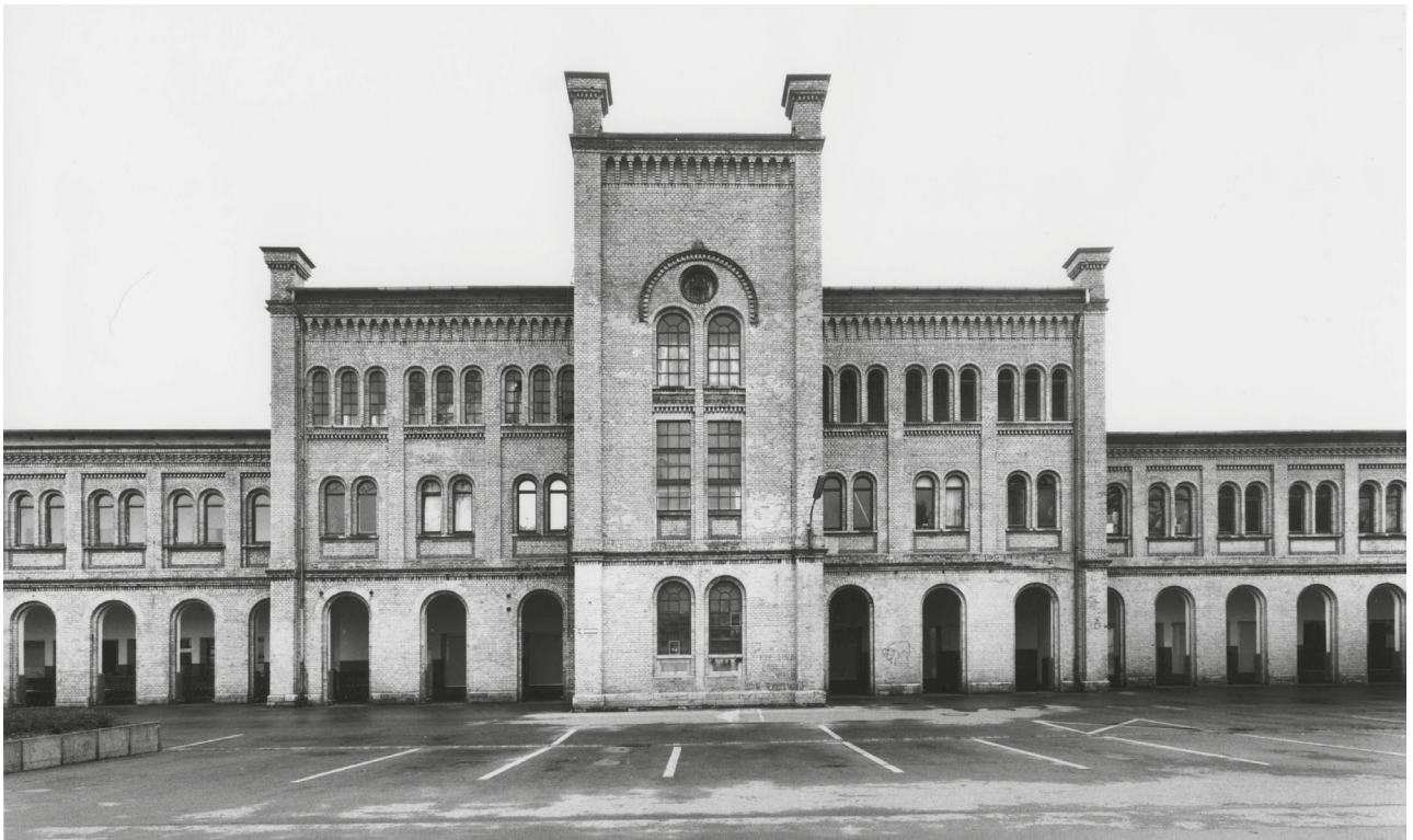
Abb. 2: Kontorgebäude der "Mechanischen Weberei", Bielefeld, Nordrhein-Westfa- len, 1864/1889, PVZ: 2022/0004-0125