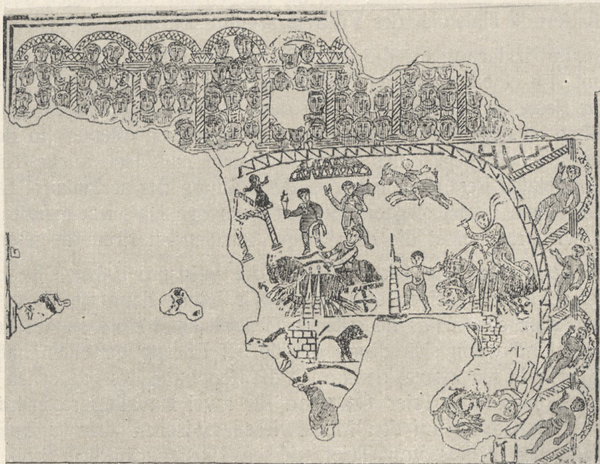
Abb. 2. Mosaikbild eines Wagenrennens im Circus aus Gafsa in Tunesien.

Literarisch ist, soviel ich sehe, die Verwendung einer solchen mappa bei der Kleidung der Wagenlenker nicht nachzuweisen, aber bildlich ist sie bezeugt auf