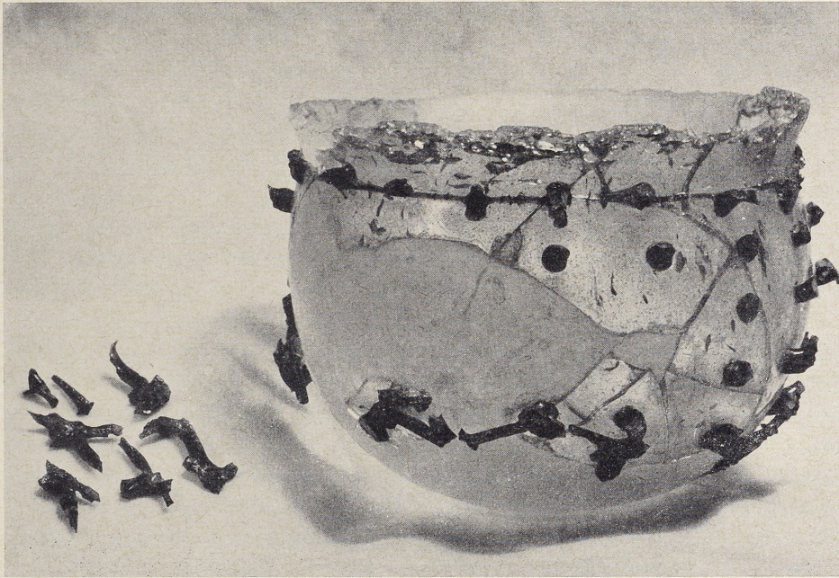
Abb. 1. Pseudo-Diatretglas von Bavai nach Zusammensetzung der vorhandenen Scherben. Die großen Fehlstellen sind ergänzt ohne Netzwerk. Links: einige Fragmente des Netzwerks

Der Becher besteht aus matt grünlich durchscheinendem und sehr blasenreichem Glas. Auf seine Wandung sind Füßchen und Stege von 4 bis 5 mm Dicke aus hell- bis dunkelblauem Glas aufgesetzt (Taf. B und Rekonstruktionszeichnung Abb. 2), die ein — jetzt größtenteils zerbrochenes — Netzwerk tragen und auf diese Weise das Gefäß mit einer breiten Ornamentzone überziehen. Diese Ornamentzone ist oben wie unten durch einen die Stützfüßchen verbindenden horizontalen Glasfaden begrenzt. Während am oberen Teil des Bechers der Ornamentschmuck bis zu 5 mm vom Glaskörper absteht, verringert sich der Abstand der Stege und die Höhe der Füßchen zum unteren Teil des Gefäßes hin, bis schließlich der blaue Glasfaden unmittelbar auf der Gefäßwand aufliegt.