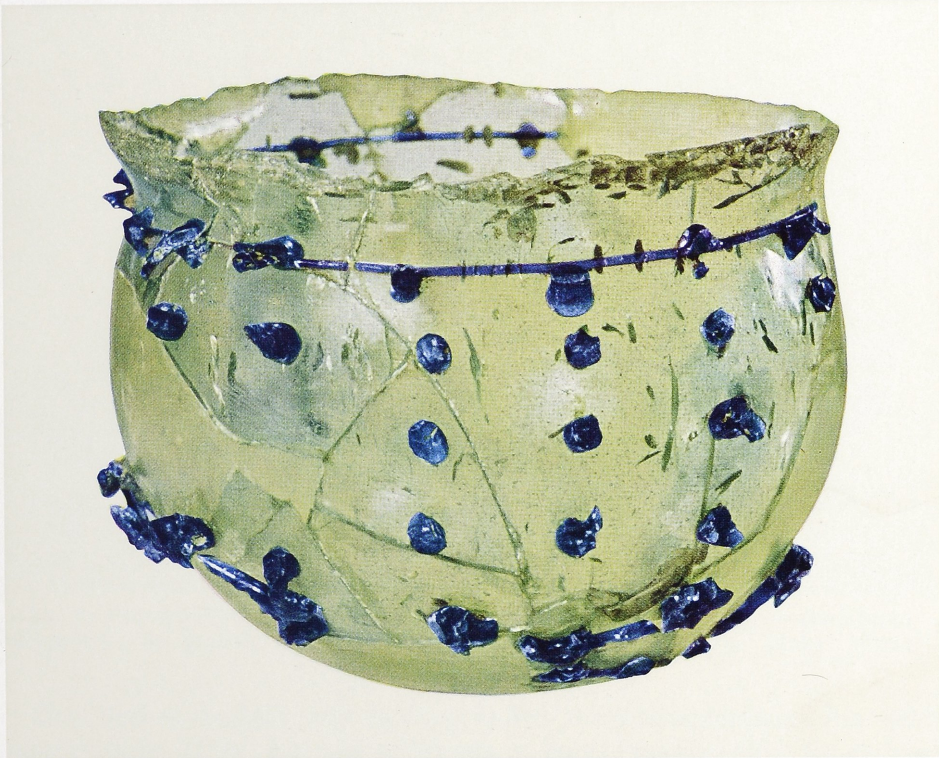
Ein römisches Pseudo-Diatretglas aus Bavai