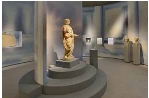
9 „Nero – Kaiser, Künstler und Tyrann“. Die Togastatue des Prinzen Nero (Musée du Louvre, Paris) im Saal „Aufstieg ohne Ausweg“.

Das größte Projekt, das seit der vielbeachteten Ausstellung „Konstantin der Große“ im Jahr 2007 in Angriff genommen wurde, war die Schau Nero – Kaiser, Künstler und Tyrann , die vom 14. Mai bis 16. Oktober 2016 in drei Trierer Museen gezeigt wurde. Das Landesmuseum als zentraler Ausstellungsort präsentierte insgesamt 430 Exponate aus 94 Museen auf rund 1 000 m 2 Fläche [Abb. 9-10]. Das inhaltliche Ziel der Ausstellung war es, ein realistischeres Bild von Nero auf der Grundlage neuester Forschungsergebnisse der Altertumswissenschaften zu vermitteln. Das Gestaltungsbüro „Atelier Hähnel-Bökens“ (Düsseldorf – Berlin) überzeugte mit einer sehr aufwendigen Inszenierung. Die Schau erwies sich abschließend als eine der erfolgreichsten des Jahres in Europa. Allein im Landesmuseum konnten 135 251 Besucher und 2 002 Gruppenbuchungen verzeichnet werden [Abb. 11]. Die Stadt Trier stand im