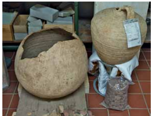
18 Trier, Paulinstraße. Grabbeigaben nach der Restaurierung in der Museumswerkstatt.

Einen hohen Zeitaufwand verursachten Maßnahmen für die stetig zunehmenden Leihvorgänge. Dazu zählen Restaurierungen der Exponate, Erstellung von Zustandsprotokollen, Verpackung der Exponate für den Transport sowie Kurierbegleitungen.