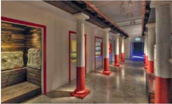
8 „Ein Traum von Rom“ – Sonderausstellung, inspiriert vom antiken Trier.

Auf einer Kooperation mit dem Landesmuseum Württemberg beruhte die Sonderausstellung Ein Traum von Rom – Römisches Stadtleben in Südwestdeutschland , die vom 15. März bis 28. September 2014 in Trier und vom 25. Oktober bis 12. April in Stuttgart präsentiert wurde 6 . Sie widmete sich der römischen Stadtkultur im Nordosten Galliens und im rechtsrheinischen Obergermanien [Abb. 8]. Dem Gestaltungsbüro Valentine Koppenhöfer aus Friedrichroda in Thüringen gelang eine beeindruckende Inszenierung des römischen Stadtlebens. Die größte Rolle in der Ausstellung spielte die römische Metropole Trier, ca. 85 % der ausgestellten Exponate stammten aus den Beständen des Museums. Aufgrund einer hervorragenden Presseresonanz und mit rund 70 000 Gästen im RLM Trier erwies sich das Projekt als sehr erfolgreich. Gut angenommen wurde auch die vom Landesmuseum Württemberg speziell für Kinder konzipierte Ausstellung „Römische Baustelle. Eine Stadt entsteht“, die parallel zur Hauptausstellung in den Thermen am Viehmarkt gezeigt und von der Mobilien Spielaktion e. V. (Trier) begleitet wurde.