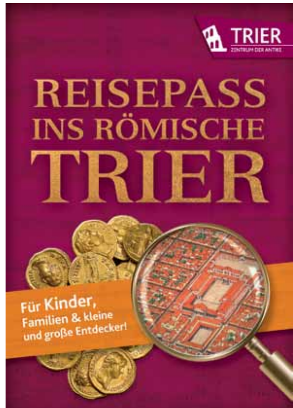
13 Kinder-Rallye mit Rätselaufgaben zum antiken Trier.

Seit Juli 2017 verbindet eine Rallye „Reisepass ins Römische Trier“ das Landesmuseum und die Römerbauten Porta Nigra, Amphitheater, Barbarathermen, Kaiserthermen und Thermen am Viehmarkt. Das Heft ist kostenlos erhältlich und lädt Eltern und Kinder ein, die römische Vergangenheit der Stadt spielerisch zu erkunden. An jeder Station muss ein Rätsel gelöst werden. Wer am Ende das richtige Lösungswort herausgefunden hat, erhält eine kleine Überraschung [Abb. 13].