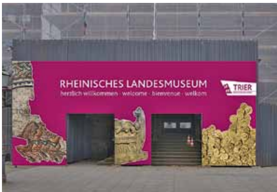
2 Der Haupteingang des eingerüsteten Museums während der Fassadensanierung.

Als letzte Maßnahme der Gesamtsanierung erfolgten im Zeitraum zwischen den großen Ausstellungsprojekten „Nero – Kaiser, Künstler und Tyrann“ (2016) und „Karl Marx 2018 – Leben. Werk. Zeit“ (2018) die Sicherung und Restaurierung der Fassade des Museumsaltbaus, die Bewuchs, Risse, Steinschäden und Verschmutzungen aufwies [Abb. 2]. Zahlreiche Firmen mit professionellen Handwerkern und Steinrestauratoren waren an der umfangreichen Maßnahme beteiligt. Die Oberflä-