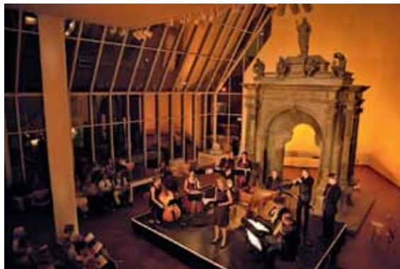
32 Konzert vor dem Grabaltar des Christoph von Rheineck.

chor Capella poetica und dem Ensemble für Alte Musik Banchetto musicale Trier zugunsten der Hospizgesellschaft Trier