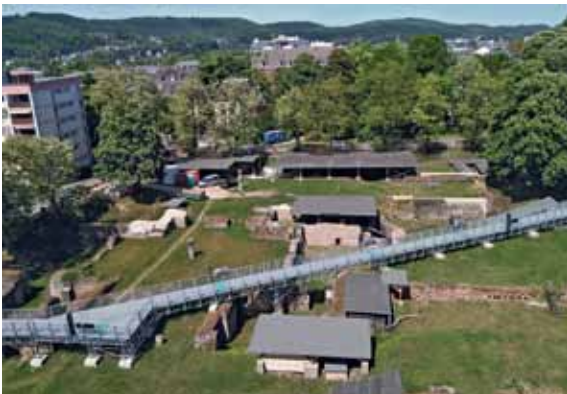
26 Trier, Barbarathermen. Neue Präsentation mit Besuchersteg.

Auf dem Gelände der Barbarathermen konnte 2015 aufgrund kurzfristig bereit gestellter EFRE-Mittel ein temporärer Besuchersteg eröffnet werden. In neun Stationen wird neben der Architektur, der prächtigen Ausstattung und dem antiken Badebetrieb die nachantike Nutzung verdeutlicht. Die sichtbaren Teile der Badeanlage werden um virtuelle Rekonstruktionen ergänzt. Im Rahmen der Umgestaltung erhielt das Areal einen kleinen Vorplatz mit Informationstafeln. Alle Maßnahmen wurden nach den Vorgaben der Barrierefreiheit durchgeführt. Ein taktiles Modell des römischen Trier sowie Texte in Leichter Sprache ergänzen die Präsentation [Abb. 26].