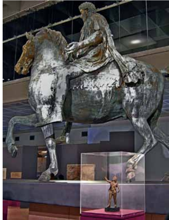
19 Bronzestatuetten des Attis von der Trierer Römerbrücke vor der Reiterstatue des Kaisers Marc Aurel in einer Sonderausstellung der Kapitولينischen Museen in Rom.