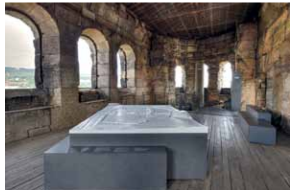
24 Trier, Porta Nigra. Informationsbereich mit Stadtmodell im Obergeschoss.

Die Porta Nigra erhielt durch umfangreiche bauliche Veränderungen einen neuen Eingangs- bzw. Kassenbereich im Erdgeschoss des Westturms. Taktile Reliefbilder, die in Zusammenarbeit mit der Hochschule Trier entwickelt wurden, informieren hier barrierefrei über die bauhistorische Entwicklung des Monuments. Ein Multimediaguide sowie eine webbasierte Smartphone-Variante ermöglichen einen virtuellen Rundgang durch die Geschichte der Porta Nigra. Ein Stadtmodell des römischen Trier sowie weitere Ausstellungselemente bilden im Obergeschoss einen eigenen Informationsbereich [Abb. 24]. Das Zwischengeschoß des Ostturms wurde für den Besucherverkehr zugänglich gemacht und mit einer multimedialen Inszenierung zur Geschichte des Hl. Simeon ausgestattet [Abb. 25].