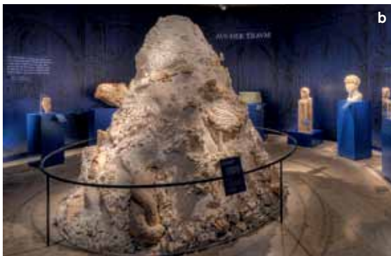
17 „Aus der Traum“ – Architekturteile und Kunstwerke aus Marmor werden im Kalkofen verbrannt. Inszenierung am Ende der Ausstellung „Ein Traum von Rom“.