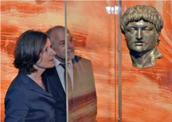
10 Besuch der Ministerpräsidentin Malu Dreyer bei der Eröffnung der Nero-Ausstellung am 13. Mai 2016.

Mittelpunkt der Kulturreisen und konnte somit ihren Ruf als „Zentrum der Antike“ festigen 9 .