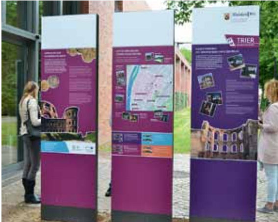
14 „Trier – Zentrum der Antike“: Werben für die Römerstadt. Infostelen vor den Kaiserthermen.

fentlichkeitswirksamen Maßnahmen entwickelt. Auch wurden Werbegeschenke und eine Ausstattung zur interaktiven Publikumsansprache auf Messen und Veranstaltungen konzipiert. Diese Produktpalette konnte stetig aktualisiert, weiterentwickelt und um neue Angebote ergänzt werden. Der Vertrieb der mehreren Hunderttausend Flyer und Broschüren pro Jahr an die Auslagestellen der GDKE sowie der touristischen Partner und an Einzelgäste durch Dienstleister wurde zentral im Landesmuseum abgewickelt.