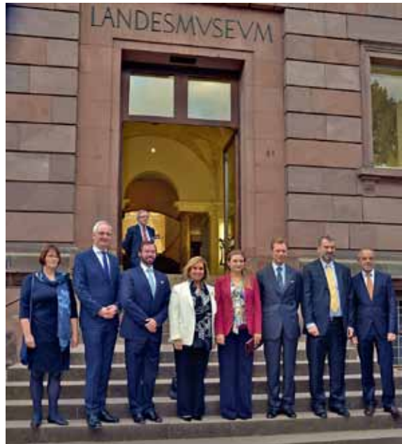
34 Besuch des Großherzogs von Luxemburg im Landesmuseum am 5. Oktober 2016.