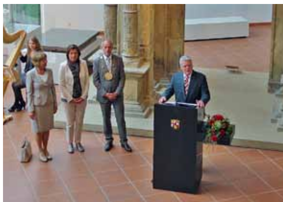
33 Besuch von Bundespräsident Joachim Gauck im Landesmuseum.