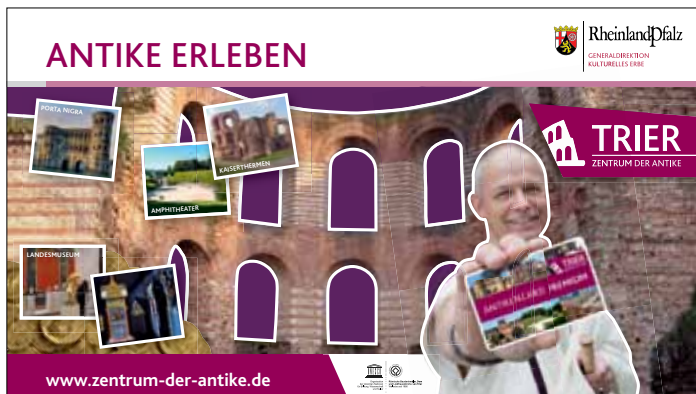
15 Werbeanzeige für die Antikencard.

Im Berichtszeitraum wurde die bereits 2011 geschaffene Antikencard, ein Ticket für Landesmuseum und Römerbauten, weiterentwickelt. Mit den neuen Angeboten, hier insbesondere mit der Antikencard Schule, konnten die Verkaufszahlen gesteigert werden und erreichten 2017 die Rekordzahl von 34 215 verkauften Antikencards. Mithilfe von Plakatkampagnen und Anzeigenschaltung hat sich die Antikencard zum wichtigsten Ticket für alle Liegenschaften des „Zentrums der Antike“ entwickelt [Abb. 15].