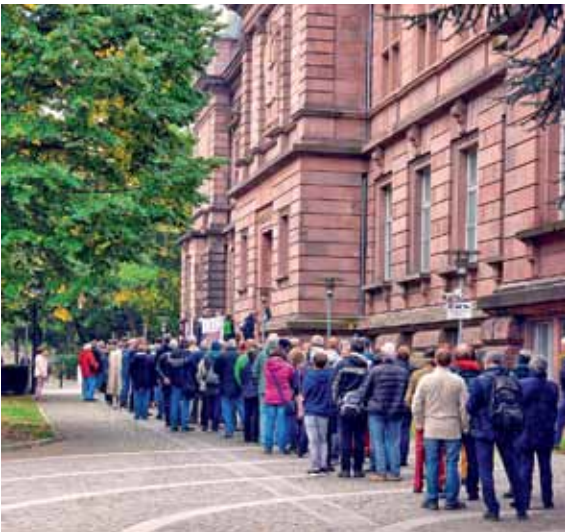
11 Besucherandrang zur Nero-Ausstellung vor dem Landesmuseum.

Im Berichtszeitraum begannen die Vorbereitungen für die gemeinsam von Land und Stadt ausgerichtete Sonderausstellung „Karl Marx 1818-1883 – Leben. Werk. Zeit“. Um die Ausstellung an den beiden Standorten, RLM Trier und Stadtmuseum Simeonstift, als Gemeinschaftsprojekt sichtbar zu machen, wurde 2015 die „Karl Marx 2018 – Ausstellungsgesellschaft mbH“ (KAMAG) als zentrales Ausstellungsbüro gegründet, welches die Koordination und Organisation des Projektes steuern sollte. Um die Zusammenarbeit zu gewährleisten, wurde zwischen der KAMAG und der GDKE eine eigene Vereinbarung getroffen. Obwohl die inhaltliche sowie organisatorische Ausgestaltung des Projektes bei der