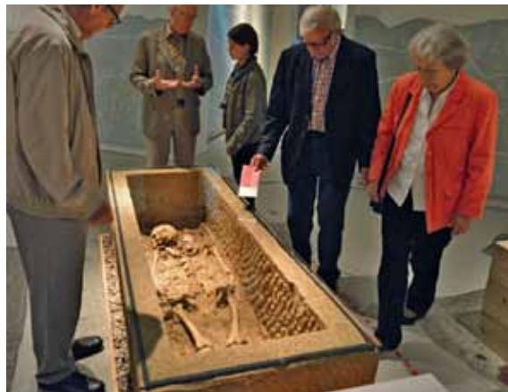
7 „Tatort Archäologie“. Körperbestattung in einem römischen Sarkophag.

Sonderausstellungen unter Einbeziehung der Arbeitsbereiche Restaurierung und Grabungstechnik. Für die Gestaltung zeichnete das Berliner Büro „Schiel Projektgesellschaft“ verantwortlich. Da die Ausstellung einen umfangreichen Blick hinter die Kulissen der Archäologischen Denkmalpflege und des Museums bot, wurden die im Rahmen des Begleitprogramms angebotenen Werkstatt- und Depotführungen sowie Grabungsbesichtigungen vom Publikum sehr gut angenommen. Als zusätzliche Angebote für Kinder lagen in der Ausstellung Warnwesten, Schutzhelme sowie ein kostenloses „Forscherhandbuch“ bereit, das als Rallye einen spielerischen Leitfaden darstellte.