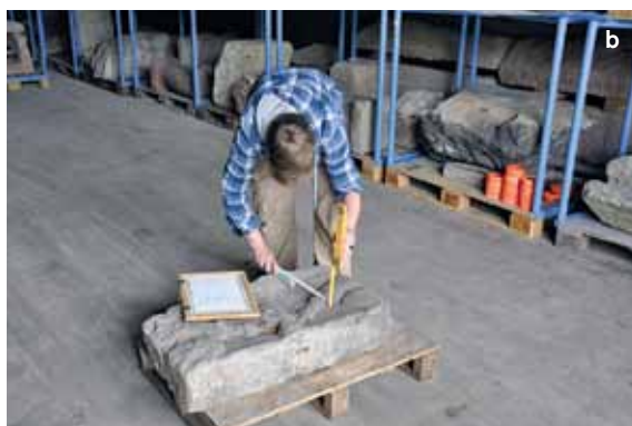
16 Arbeiten in den Depots zur Erfassung römischer Grabdenkmäler für das DFG-Projekt.

gemeinschaft „Römische Grabdenkmäler aus Augusta Treverorum im überregionalen Vergleich“, für das über 1800 Teile von Grabmälern und Architekturen dokumentiert und fotografiert wurden [Abb. 16]. 260 Stücke wurden außerdem von Mitarbeitern der Hochschule Mainz (i3mainz – Institut für Raumbezogene Informations- und Messtechnik) gescannt.