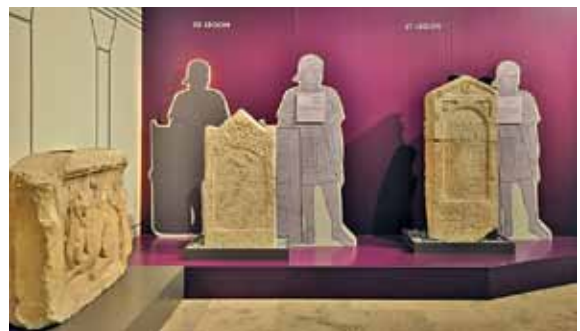
5 „Im Dienst des Kaisers“. Grabsteine römischer Legionäre aus Mainz in der Sonderausstellung.

Vom 24. August 2012 bis 7. April 2013 wurde die Ausstellung Im Dienst des Kaisers: Mainz – Stadt der römischen Legionen gezeigt, ein Projekt der GDKE mit den Direktionen RLM Trier, Landesmuseum Mainz und der Landesarchäologie. Anhand von rund 250 Exponaten, wie Soldatengrabsteinen, Waffen und Ausrüstungsgegenständen aus der Sammlung des Landesmuseums Mainz, konnte das Dienst- und Alltagsleben römischer Legionen am Rhein veranschaulicht werden [Abb. 5]. Während das Ausstellungskonzept extern vergeben und unter Mitarbeit der beiden Landesmuseen erstellt wurde, erfolgte die Umsetzung ausschließlich durch das RLM Trier unter Beteiligung einer größeren Projektgruppe, bestehend aus Wissenschaftlern, Steuerungsteam, Museumsdidaktik etc. Hervorzuheben ist die Arbeit des Museumsgrafikers Franz-Josef Dewald, der für die Gestaltung der Ausstellung verantwortlich