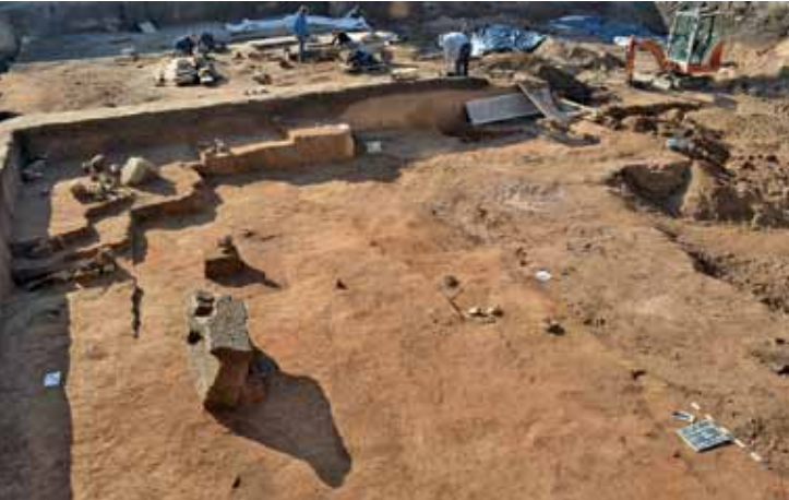
22 Trier, Paulinstraße 20/24. Ausgrabung eines römischen Gräberfeldes des 1.-3. Jhs.