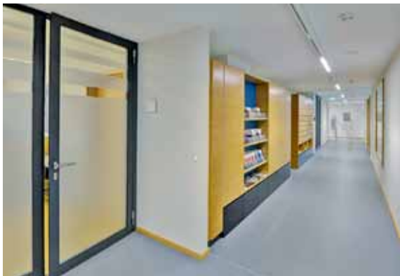
1 Zweites Obergeschoss des Verwaltungsbaus (Direktionsetage) nach der Sanierung.

sich über die etwas höher gelegene Ebene des bogenförmigen Westflügels erstrecken. Von dort führt eine neue Treppe in das Dachgeschoss des Nordflügels, wo die Abteilungen Foto und Grafik sowie das Museumsarchiv untergebracht wurden. In der zweiten Etage des Südflügels liegen die Direktion, das Sekretariat mit Poststelle, die Räume der Personal- und Finanzverwaltung und der Konferenzraum [Abb. 1]. Im Dachgeschoss befinden sich die Büros der Landesarchäologie, das Dendrochronologische Forschungslabor sowie das Planarchiv mit den Ortsakten 3 .