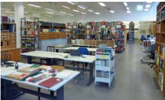
27 Die Museumsbibliothek im Ausweichquartier Moltkestraße, 2013-2015.

Im November 2015 wurde die Bibliothek im sanierten Verwaltungsgebäude wieder für die Benutzung geöffnet. Herzstück ist der im früheren Vortragssaal eingerichtete neue Lesesaal mit einem auf das Doppelte erweiterten Informationsapparat. Auf der Empore