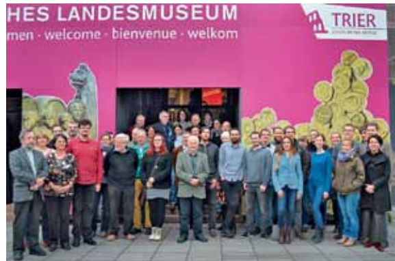
20 Die Teilnehmer des Archäologischen Kolloquiums des RLM Trier am 18. November 2017.