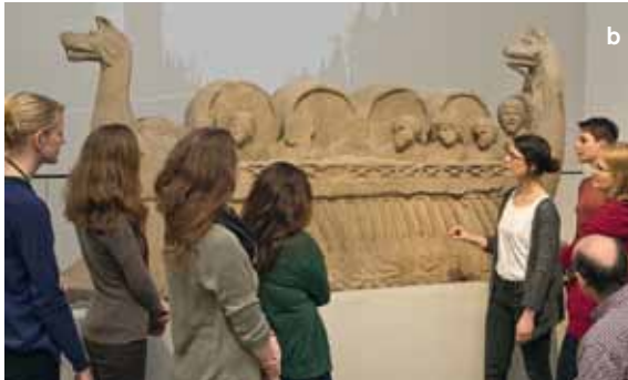
12 Museumsdidaktische Aktionen vor dem römischen Weinschiff aus Neumagen. a Kinder-Rallye. b Themenführung.

Im Juni 2017 wurde erstmals ein historisch-archäologischer Science Slam unter dem Motto „Neues aus der Vergangenheit“ veranstaltet. Mit rund 100 Besuchern, überwiegend Studierenden, erwies sich das Format als erfolgreich.