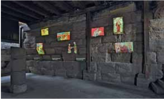
25 Trier, Porta Nigra. Klause des Hl. Simeon mit multimedialer Inszenierung im Zwischengeschoss.

Mithilfe einer EFRE-Förderung konnte der Ausstellungsbereich in den Kaiserthermen modernisiert und durch einen Filmkubus sowie Mediaguides ergänzt werden. Im Außenbereich entstanden Glasscheiben, sog. Zeitfenster, die mit virtuellen Rekonstruktionen bedruckt wurden und einen perspektivgetreuen Blick auf den antiken Zustand ermöglichen. Weitere Tafeln informieren über die laufenden Restaurierungsmaßnahmen an den Kaiserthermen.