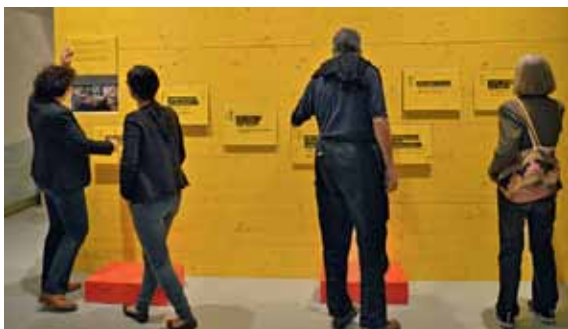
6 „Tatort Archäologie“. Aktionswand in der Sonderausstellung zur archäologischen Arbeit des Museums.

In einem für das Landesmuseum Trier neuen Format wurde zwischen dem 12. Juni 2013 bis zum 12. Januar 2014 die Schau Tatort Archäologie – Spurensuche im Boden präsentiert. Diese u. a. an Familien gerichtete Mitmach-Ausstellung verfolgte das Ziel, archäologische Arbeitsmethoden zu veranschaulichen und zu erklären, wie Archäologie funktioniert und warum Grabungen überhaupt durchgeführt werden [Abb. 6-7]. Eine tragende Rolle kam in diesem Projekt folglich der methodischen Umsetzung und damit der Museumspädagogik zu 5 . Das Projektteam bestand aus Kollegen der Landesarchäologie sowie der Projektgruppe für