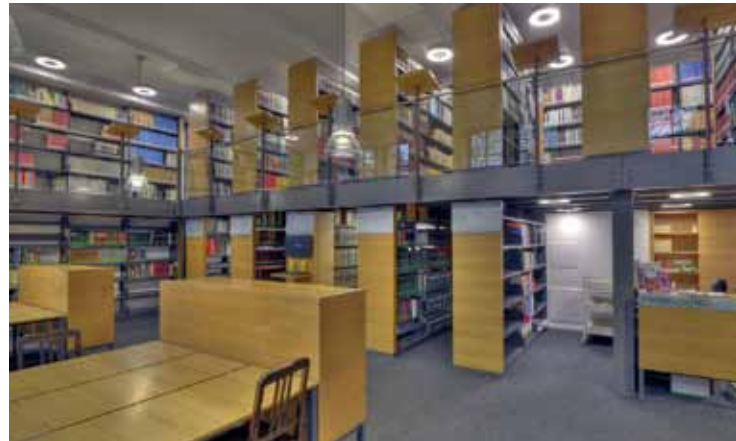
28 Der Lesesaal der neuen Museumsbibliothek, 2016.

steht ein Freihandbestand mit einer Auswahl von 300 Zeitschriften und Serien zur Verfügung [Abb. 28]. Im 1. Obergeschoss wurden zwei Büchermagazine mit einer Kapazität von 2000 Stellmetern eingerichtet. Im neuen Rara-Kabinett sind die frühen Druckwerke bis 1850 sowie Handschriften und Tafelwerke untergebracht 16 .