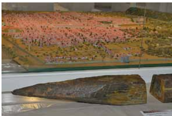
21 Trier, Franz-Ludwig-Straße. Eichenholzfunde aus einer Baugrube unter der römischen Stadtmauer nahe der Porta Nigra aus dem Winter 169/170.