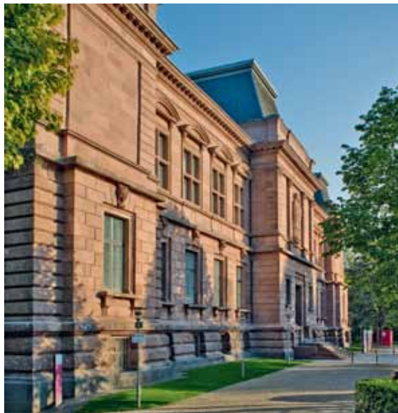
3 Außenansicht des Museums nach der Fassadensanierung.

chen wurden durch Heißdampf von Moosen und Flechten befreit, hartnäckige Verschmutzungen mit einem substanzschonenden Niederdruckstrahlverfahren bearbeitet. Schadhafte Fugen mussten herausgenommen und mit farblich passendem Kalkmörtel ohne Zement- und Kunststoffzusätze neu verfugt werden. Verwitterte Steinbereiche, darunter Reliefs, wurden in aufwendiger Steinmetzarbeit ersetzt oder ergänzt. Lose, zum Teil absturzgefährdete Bauteile konnten je nach Größe mit punktuellen alterungsbeständigen Epoxidharzverklebungen fixiert oder mit speziellen Ankerverfahren befestigt werden. Die durch Splittereinschläge aus dem Zweiten Weltkrieg entstandenen Schäden wurden beseitigt, Spuren davon jedoch als historische Zeugnisse sichtbar belassen [Abb. 3].