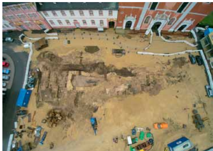
23 Prüm, Hahnplatz. Ausgrabungen in der mittelalterlichen Abtei.