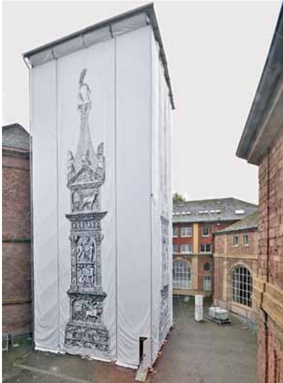
4 Kopie der eingerüsteten Igeler Säule im Innenhof des Museums mit Rekonstruktionszeichnung auf der Plane, 2012.

dennoch einen Eindruck von der Igeler Säule zu geben, wurden die Planen mit den bekannten Rekonstruktionszeichnungen von Lambert Dahm bedruckt [Abb. 4]. Das Sanierungs- sowie Restaurierungskonzept des Monuments harren seitdem einer Realisierung.