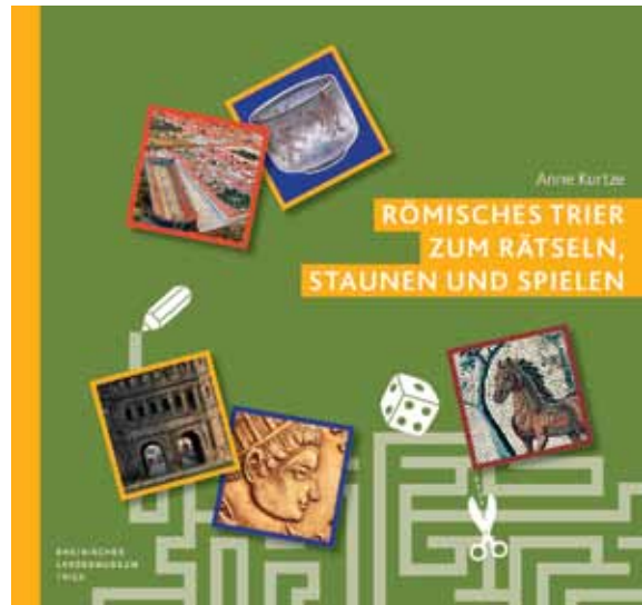
29 Das neue Kinderbuch des Museums.

Nero – Kaiser, Künstler und Tyrann. Kurzführer zur Sonderausstellung im Rheinischen Landesmuseum Trier, 14. Mai bis 16. Oktober 2016. Texte von Katharina Ackenheil und Korana Deppmeyer. 2016. 47 S.