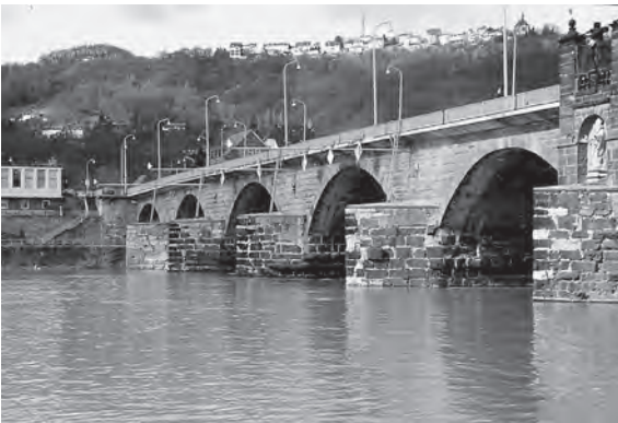
1 Trier, Römerbrücke. Ansicht von Norden.

Bronzemünzen der Städte des griechischen Ostens dienten zur Deckung des lokalen, allenfalls regionalen Kleingeldbedarfes. Der Fernhandel oder die Zahlung der Steuern erfolgte mit Hilfe der römischen Reichsprägung in Silber und Gold. Trotzdem finden sich gelegentlich griechische Prägungen weit außerhalb ihres eigentlichen Umlaufgebietes. Die Moselfunde unterhalb der Trierer Moselbrücke [Abb. 1] brachten zwei solcher Münzen zum Vorschein. Sie sind insofern bemerkenswert, weil man bei ihnen den zufälligen Verlust ausschließen kann 1 .