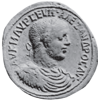
Vorderseite C (C-782)