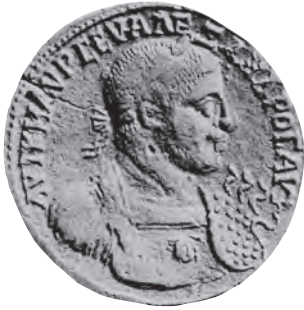
Vorderseite D (D-784)