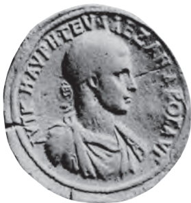
Vorderseite A (A-778)

7 Perinth. Münzen des Severus Alexander mit Vorderseitenstempel D und E, 233 n. Chr.