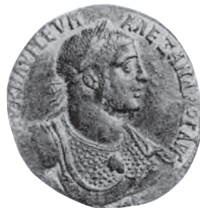
Vorderseite B (B-779)