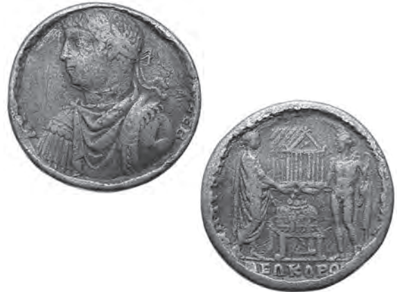
3 Berlin, Münzkabinett. Zum Protokontorniat umgearbeitete Münze des Elagabal aus Philippopolis, 218/219 n. Chr.

Rückseite: ΜΗΤΡΟΠΟΛ[ΕΩΣ ΦΙΛΙΠΠ]ΠΟΠ[ΟΛΕΩΣ] // ΝΕΟΚΟΡΟ[V]. Der Kaiser Elagabal, in zivilem Gewand (als Togatus) hält gemeinsam mit dem rechts stehenden Hermes den Neokorietempel. Darunter steht ein Tisch mit einer Preiskrone, darauf fünf Äpfel, unten an dem Tischbein ein Geldbeutel.