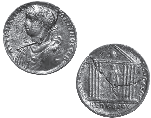
2 Trier, Römerbrücke. Zum Protokontorniat umgearbeitete Münze des Elagabal aus Philippopolis, 218/219 n. Chr.

Rückseite: ΜΗΤΡΟΠΟΛΙ-ΑΕΩΣ – ΦΙΛΙΠΠΟΠΟΛΙΩΝ // ΝΕΟΚΟΡΟΝ. Achtsäulige Tempelfront mit Schild und