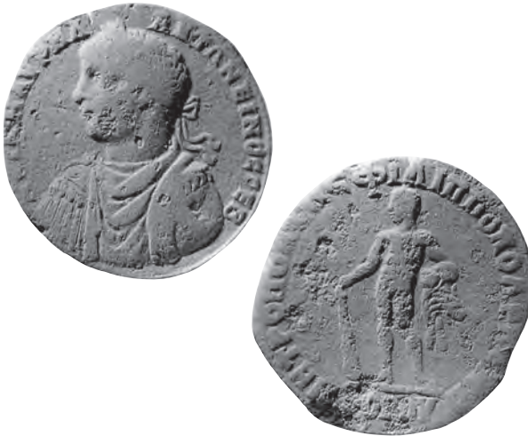
4 Athen, Agora. Münze des Elagabal aus Philippopolis, 218/219 n. Chr.

Zur selben Emission gehörig ist auch ein Münztyp mit einem stehenden Herakles, von dem ein Exemplar auf der Agora von Athen gefunden wurde [Abb. 4]: