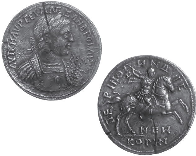
6 Trier, Römerbrücke. Münze des Severus Alexander aus Perinth, 233 n. Chr.

Vorderseite: AVT K M AVP CEVH ALEXANDPOV AVT. Panzerbüste des Severus Alexander mit Lorbeerkranz mit Ägis über der linken Schulter in der Brustansicht nach rechts.