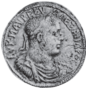
Vorderseite E (E-790)