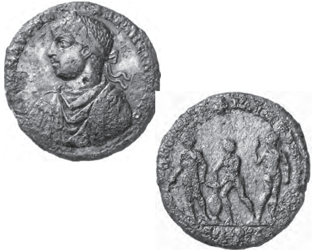
5 New York Sale. Münze des Elagabal aus Philippopolis, 218/219 n. Chr.

Der Athener Fund ist ein weiterer Beleg, wie weit gerade die Münzen dieser Emission gewandert sind. Der Vollständigkeit halber sei noch ein weiterer Rückseitentyp der Emission erwähnt, der auf der Rückseite den Aspekt der Spiele in Verbindung mit der Neokorieerteilung darstellt [Abb. 5]: