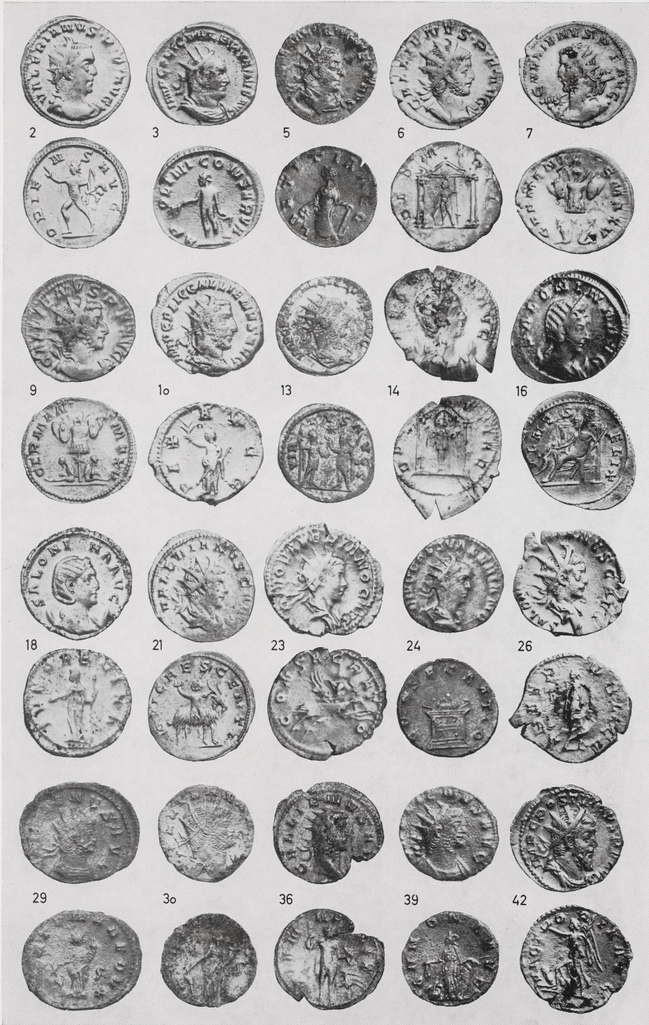
Abb. 1 Antoniniane aus dem Schatzfund Trier, Saarstr. (Nummern wie im Katalog). 1:1