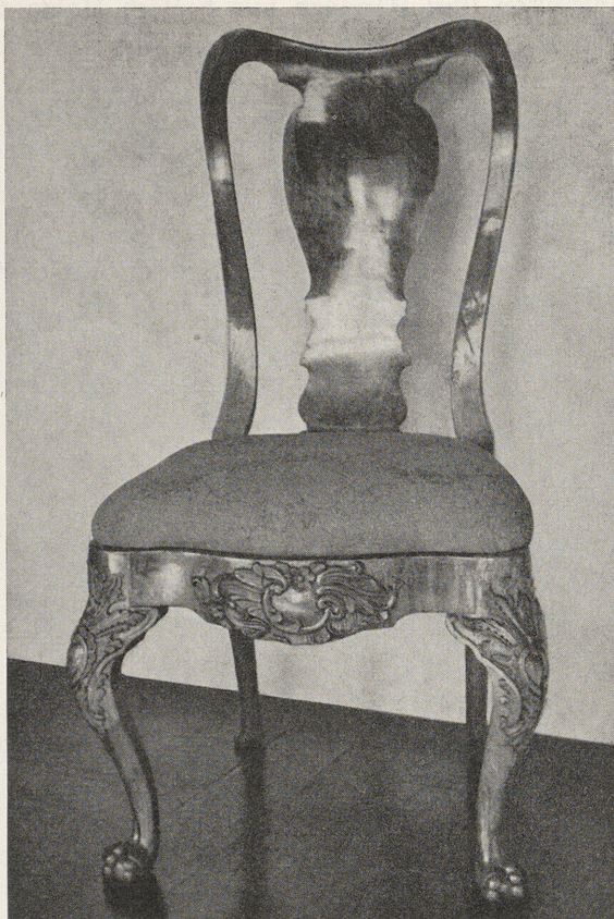
Abb. 2. Stuhl von Abraham Roentgen, um 1750/55. Nußbaum. Maße: 1,04 m hoch, 0,58 m breit, Sitztiefe 0,42 m Kreismuseum Neuwied

ingelegt ist, sowie die Form und Stellung der Vorder- und Hinterbeine gemeinsam. Die Kugelklauenfüße sind ein wenig derber als die der Pommersfeldener Stühle. Die Rücklehne klingt mit derjenigen der Büdinger Stühle zusammen, doch fehlen an dem Mittelbrett die Einlagen. Neu ist daran die der mittleren Zargenausbuchtung aufgelegte Flachschnitzerei. Der Stuhl dürfte um 1750 bis 1755 anzusetzen sein.