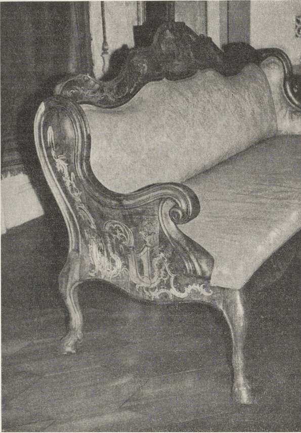
Abb. 4. Kanapee aus Nußbaumholz, um 1765. Schloß Molsberg

bretter dagegen an den Rändern mit eingelegten Streifen verziert sind. Das einzige auf uns gekommene Stück davon steht im Schloß Pommersfelden. Es bildet mit den vier entsprechenden Stühlen eine Garnitur 31 . Der jüngere, mit Rücklehnpolster ausgestattete Typ hat sich in zwei schönen Beispielen bis heute in von Walderdorffschem Familienbesitz auf Schloß Molsberg im Westerwald erhalten (Abb. 4) 32 . Die Armlehnen und Füße sind recht kräftig gewählt und stark geschwungen, die Zargen verhältnismäßig breit gelassen und geschweift. Auf den oberen Querfriesen, an den Seitenflächen der Armlehnen und an den Zargen begegnen uns äußerst fein geschnittene, z. T. gravierte Einlagen aus Ahornholz. Dargestellt sind mehrere Gruppen spielender Putten in Ruinenlandschaften, verbunden mit