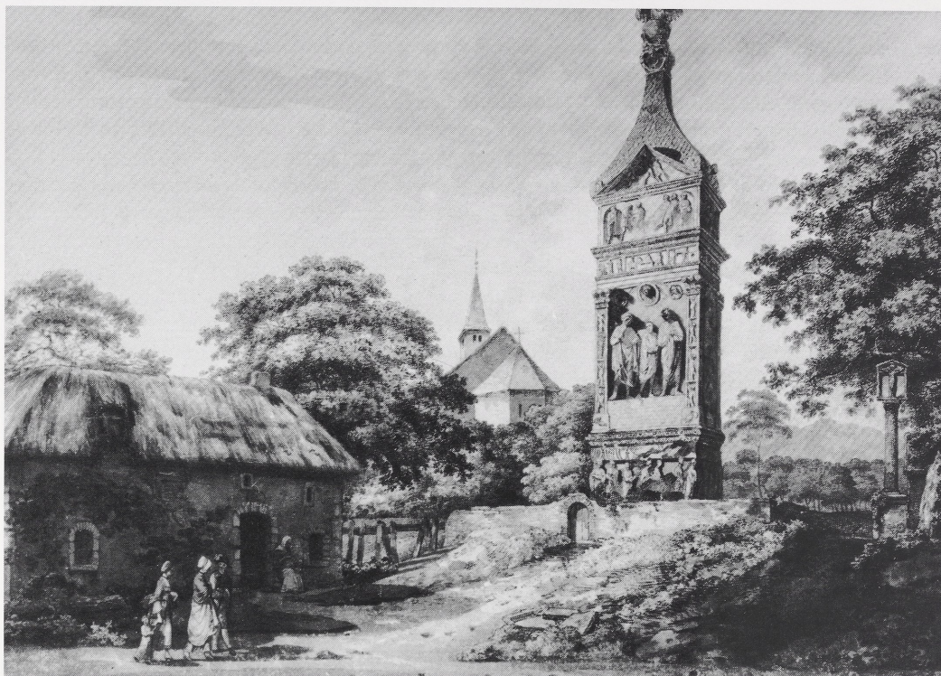
Abb. 1. William Pars: Roman Monument at Igel, Luxemburgh (Whitworth Art Gallery Manchester).

Nach Metz besichtigten die Engländer noch den römischen Aquädukt von Jouy-aux-Arches und setzten ihre Reise über Meaux und Paris fort (2. Oktober), um endlich nach England zurückzukehren, wo Pars seine Zeichnungen ausarbeitete. 7 Schweizer Aquarelle sowie die Ansicht der Igeler Säule wurden 1771 in der Royal Academy ausgestellt (Cat. No. 143–150).