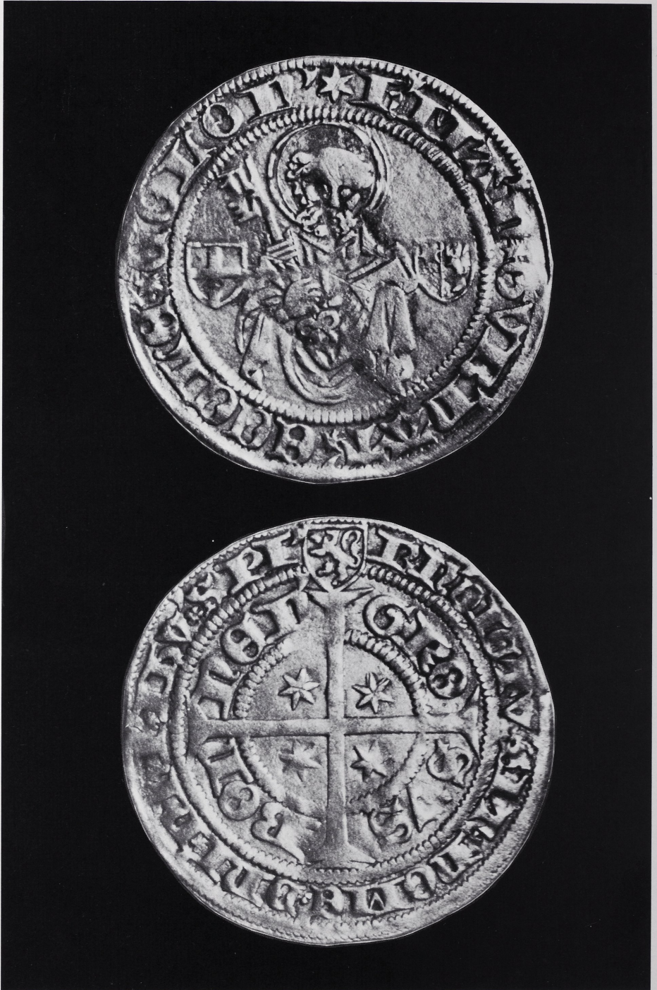
Abb. 1 Bonner Blanken Hermanns von Hessen als Gubernator des Erzstifts Köln, Dm. 24,5 mm (Nr. 47).