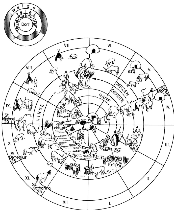
Abb. 1 Kreisdiagramm mit der Rekonstruktion der halbnomadischen Landwirtschaft während der verschiedenen Jahreszeiten (nach György GYÖRFFY)

Neben diesen zwei gut ausgearbeiteten, »grundlegenden« Rekonstruktionsmodellen für die ungarische Gesellschaft des 10. Jahrhunderts gibt es zumindest noch zwei weitere, nur von wenigen Fachleuten vertretene und deswegen mehr oder weniger vage Theorien. In ihrer Formulierung spielten einige ungarische Archäologen eine entscheidende Rolle. Dieser Umstand brachte aber nur wenig neue Elemente in die Debatte, da auch diese Rekonstruktionsmodelle sich größtenteils auf die schon erwähnten historischen und linguistischen Angaben stützen. Die einzelnen Meinungen wurden meistens nur in ungarischer Sprache publiziert, mit fremdsprachigen Zusammenfassungen die oft zu kurz und deswegen für die Bildung einer selbstständigen Meinung nicht geeignet sind. Allein schon deshalb sollen die Resultate dieser Versuche kurz zusammengefasst werden.